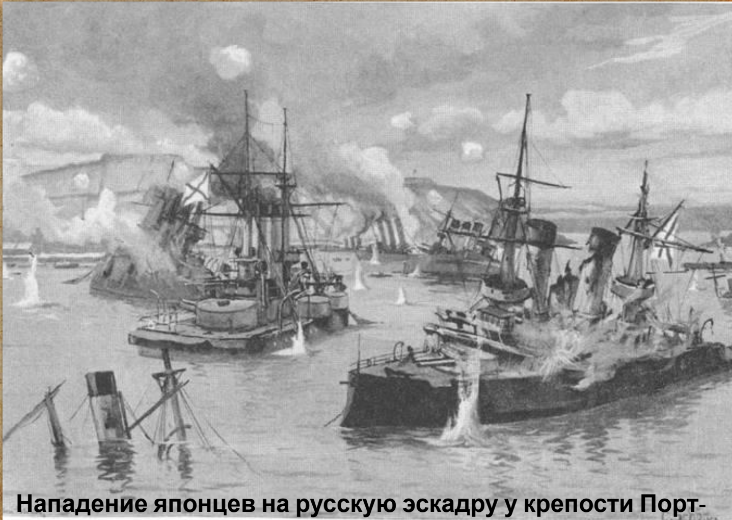
Нападение японцев на русскую эскадру у крепости Порт-Артур.