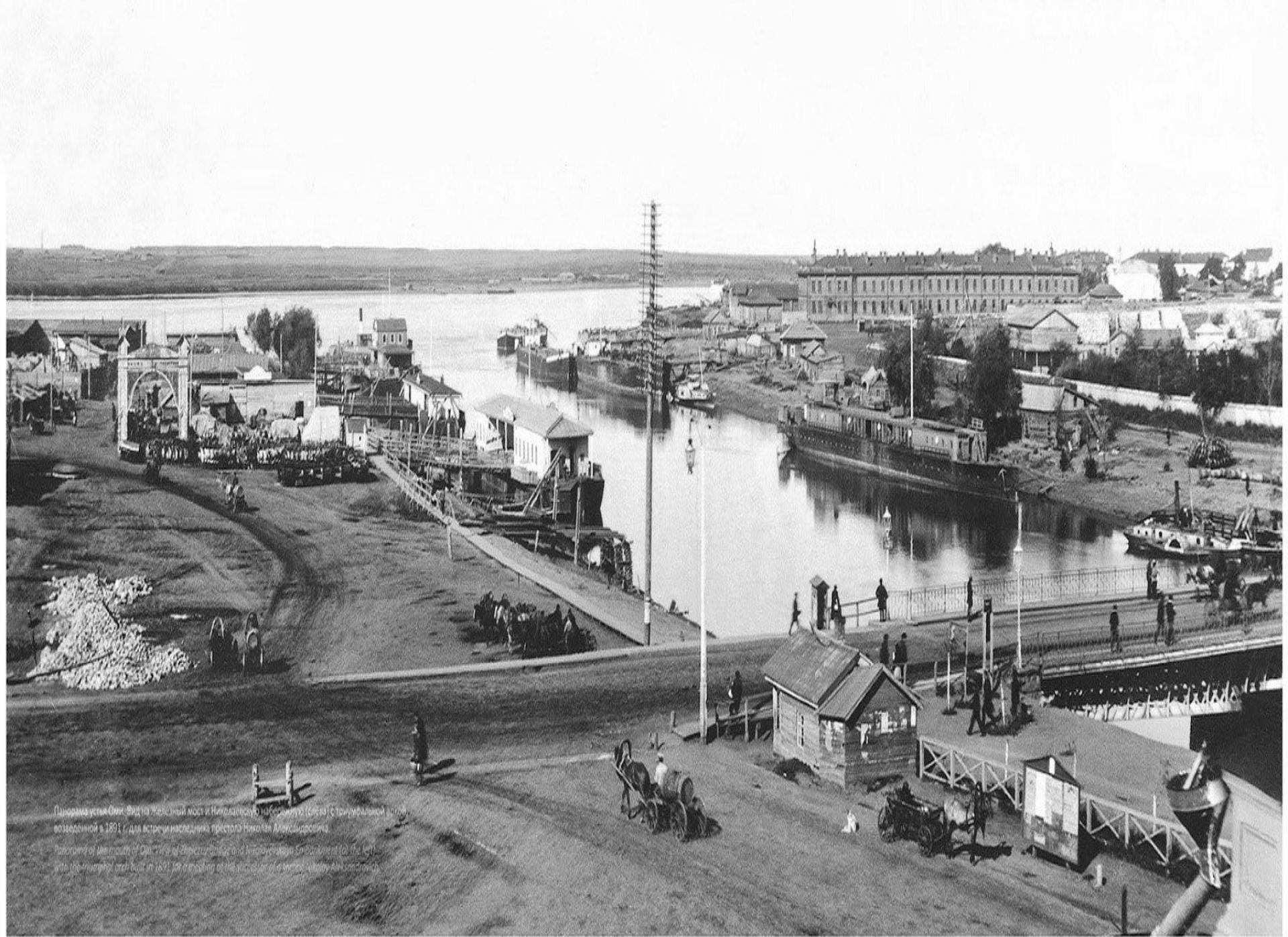
Панорама устья Оки. Вид на Железную мост и Николаевскую набережную (слева) с триумфальной аркой, возведенной в 1891 г. для встречи наследника престола Николая Александровича.