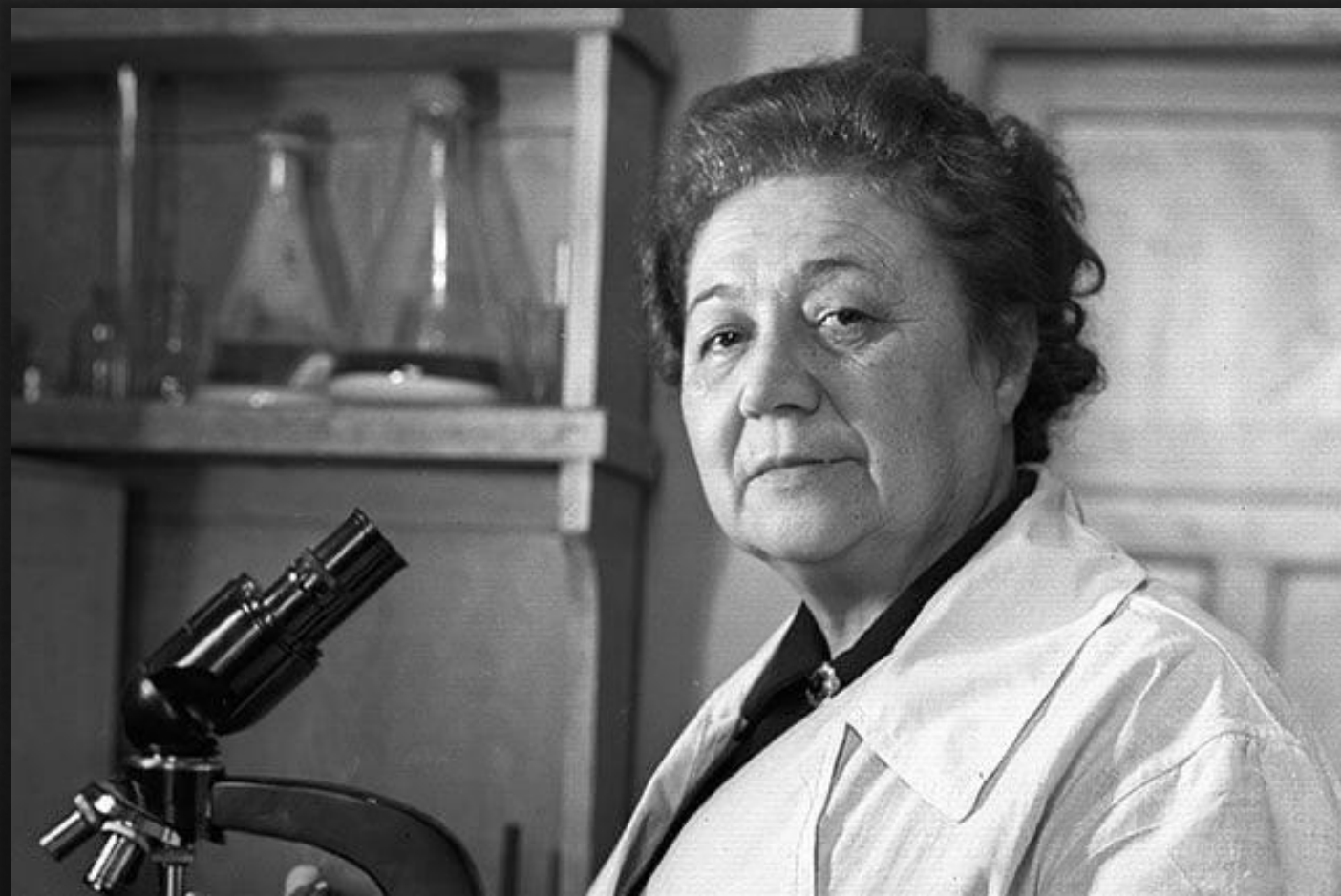
Зинаида Виссарионовна Ермольева