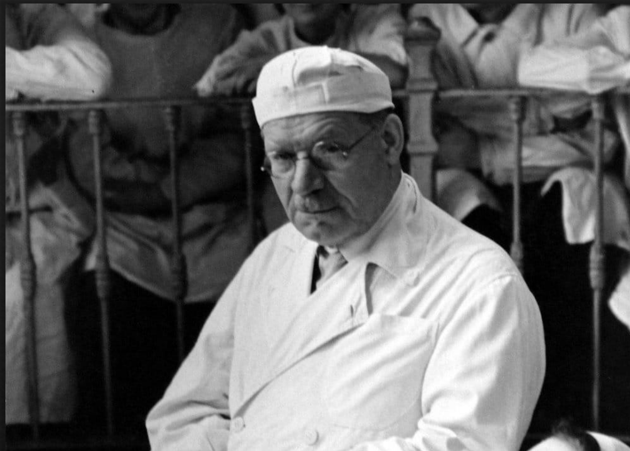
Николай Нилович Бурденко