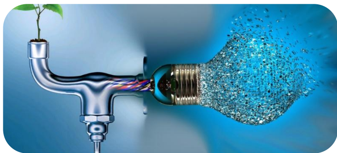
Затраты воды и электроэнергии