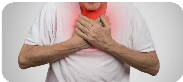
Влияние на здоровье