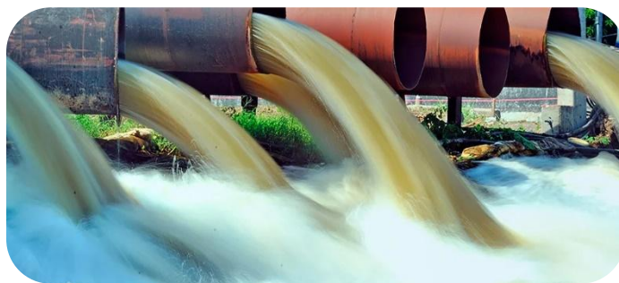
ОВ в сточных водах