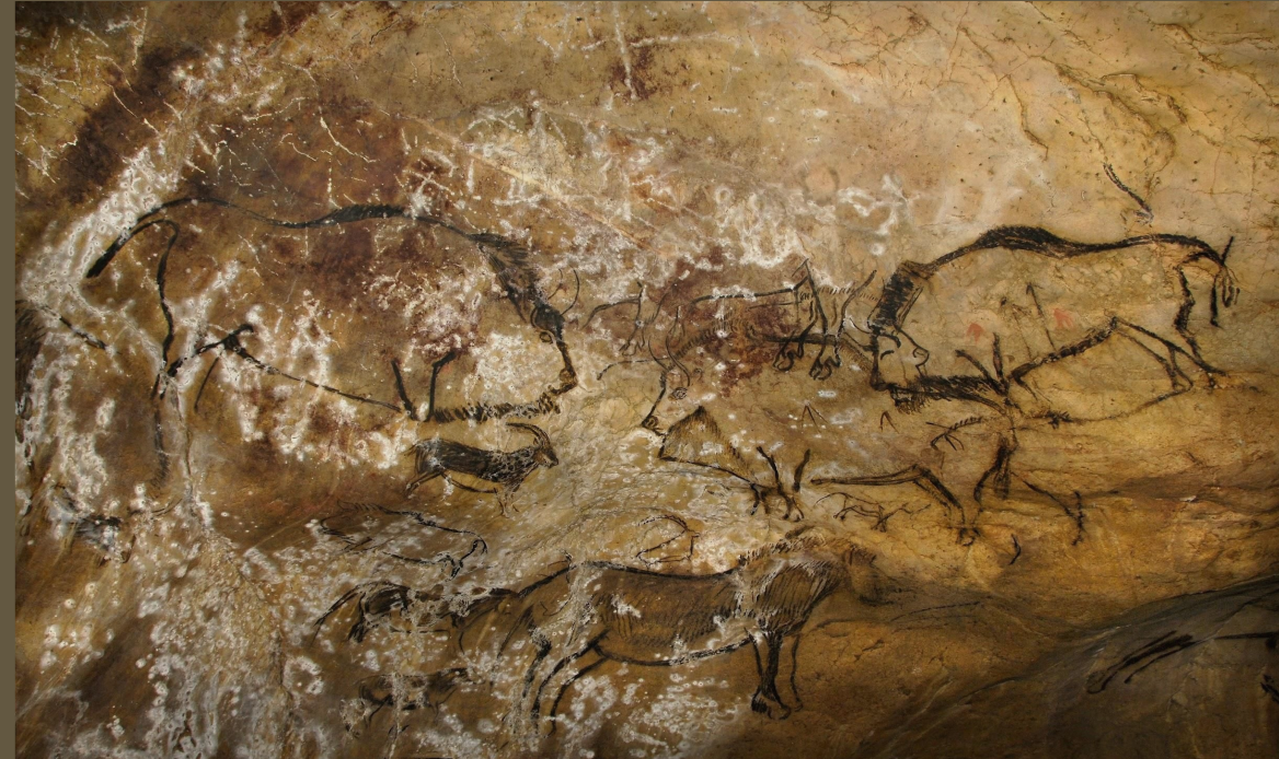
Панно из "Чёрного салона"

1970 г. - очередная экспедиция обнаружила зал, ему дали название «Ресо-Кластр».