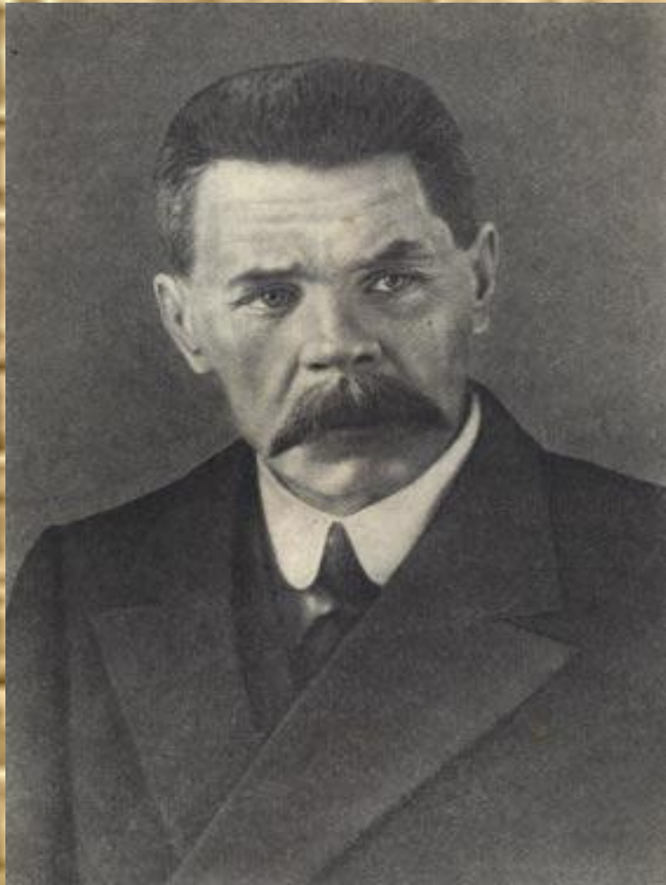
Максим Горький 1868 - 1936