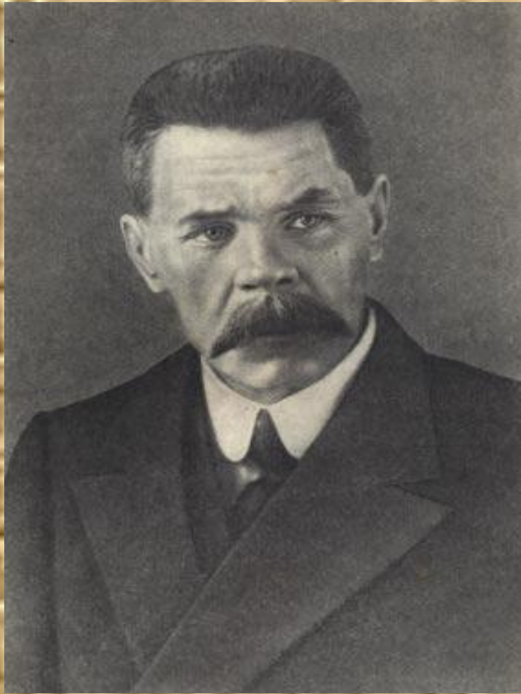
Максим Горький 1868 - 1936