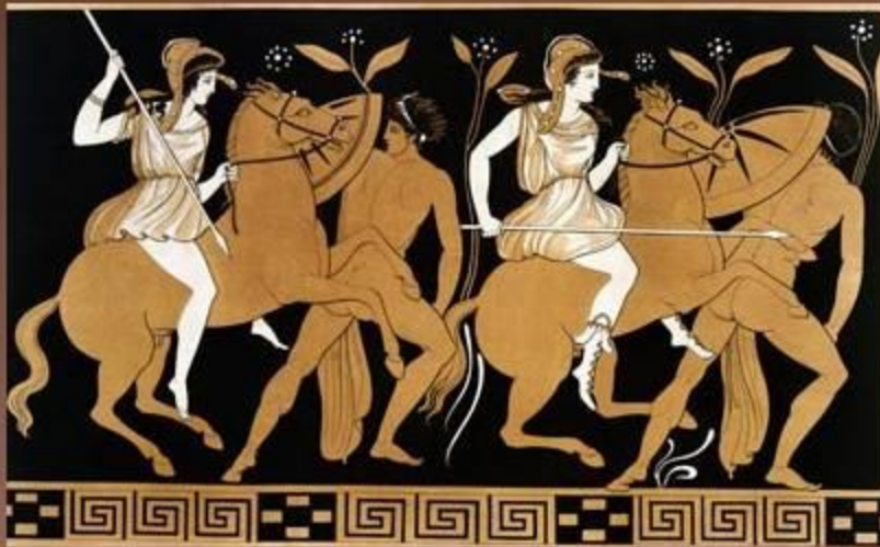
Древнегреческая живопись . Чернофигурные вазы