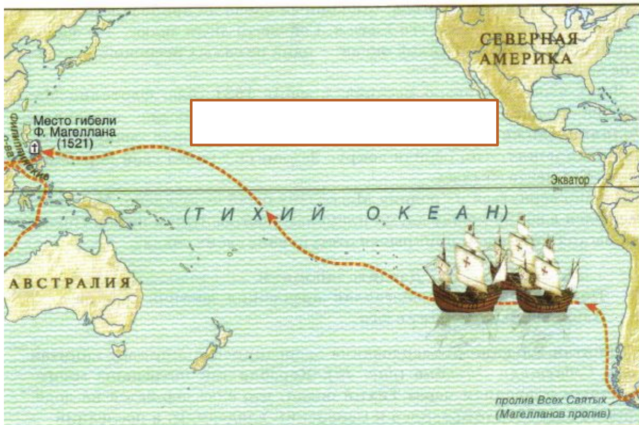
Рис. 39. Магеллан и его кругосветное путешествие