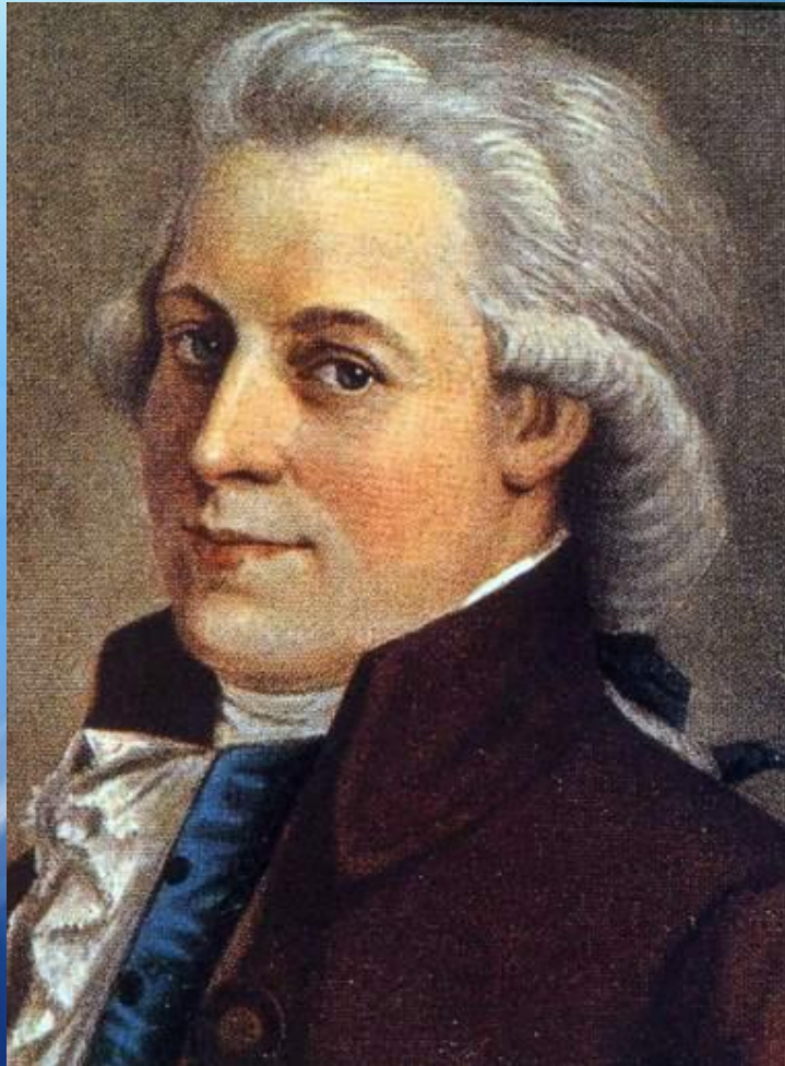
Вольфганг Амадей Моцарт

Концерт № 23 для фортепиано с оркестром.