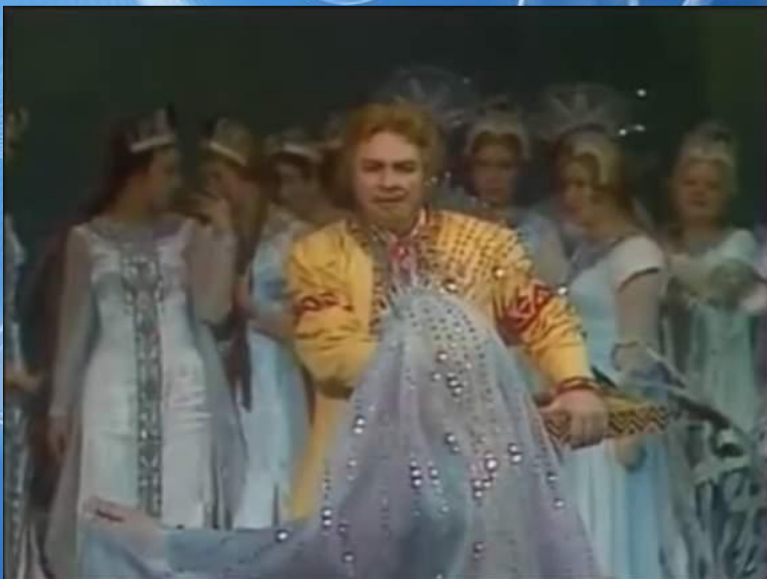
Николай Андреевич Римский- Корсаков