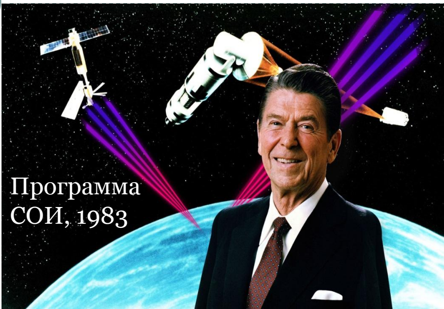
Программа СОИ, 1983