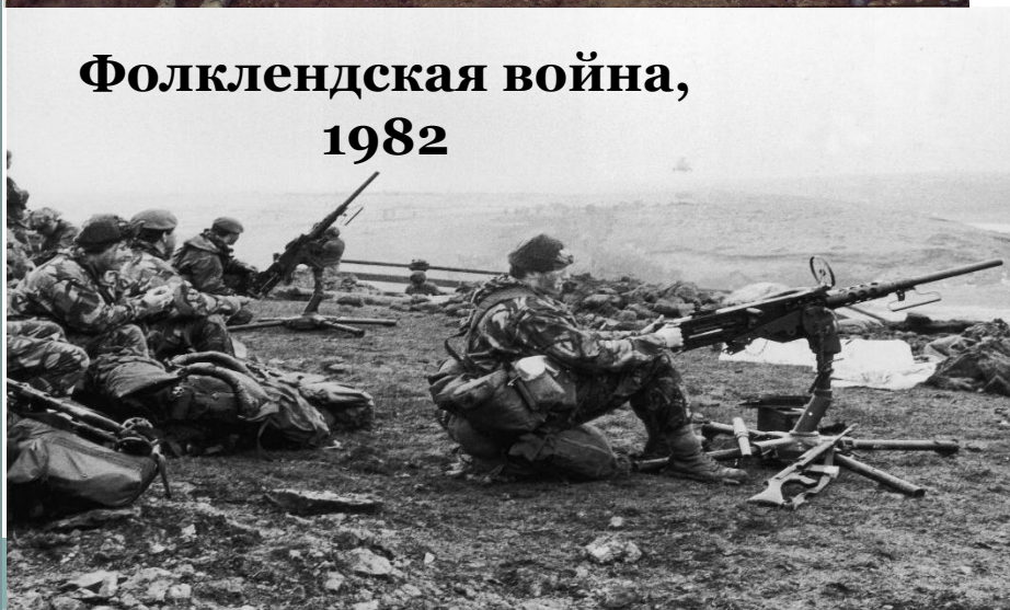
Фолклендская война, 1982