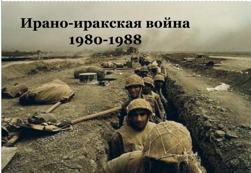
Ирано-иракская война 1980-1988