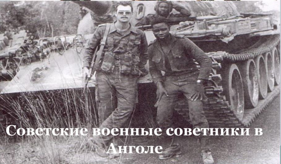
Советские военные советники в Анголе