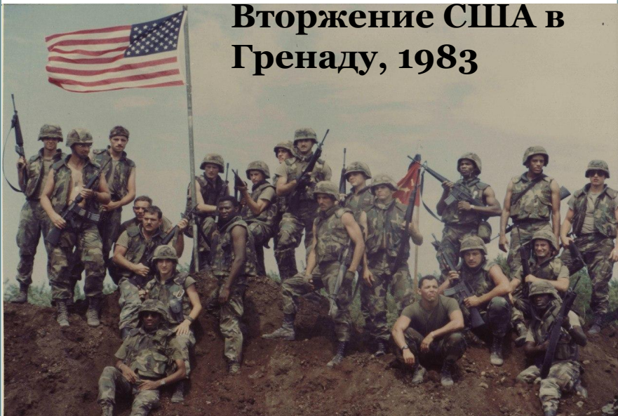
Вторжение США в Гренаду, 1983