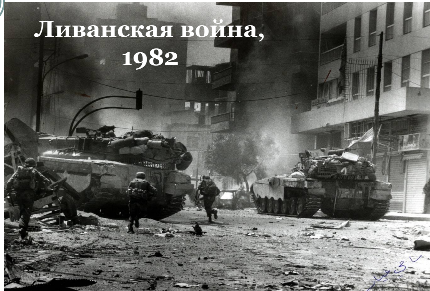
Ливанская война, 1982