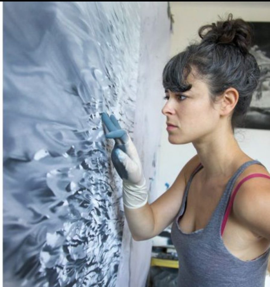
Картина Зарины Форман, написанная пальцами