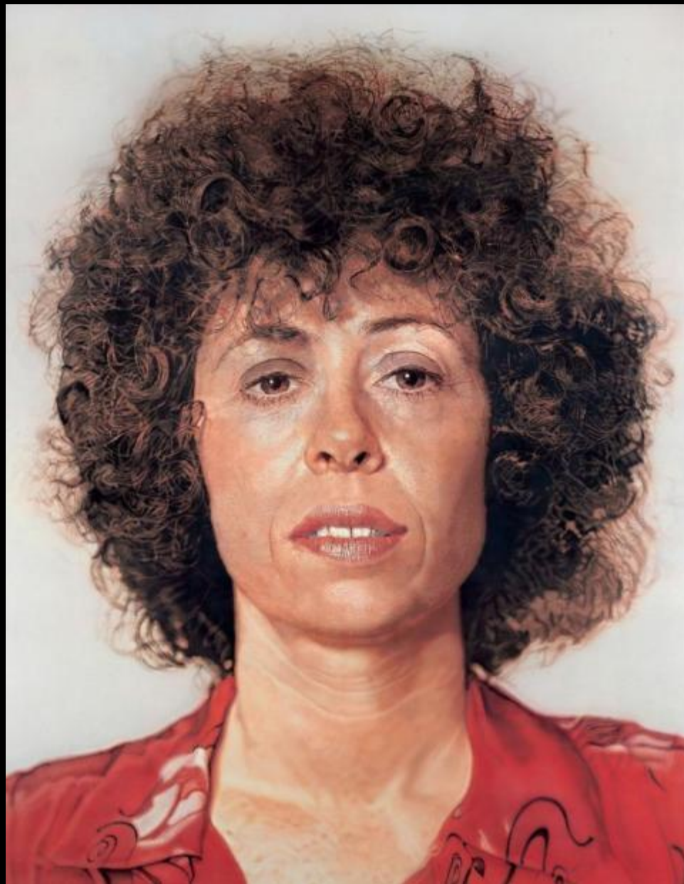
Чак Клоуз. Линда. 1975–1976 годы © Chuck Close / Akron Art Museum