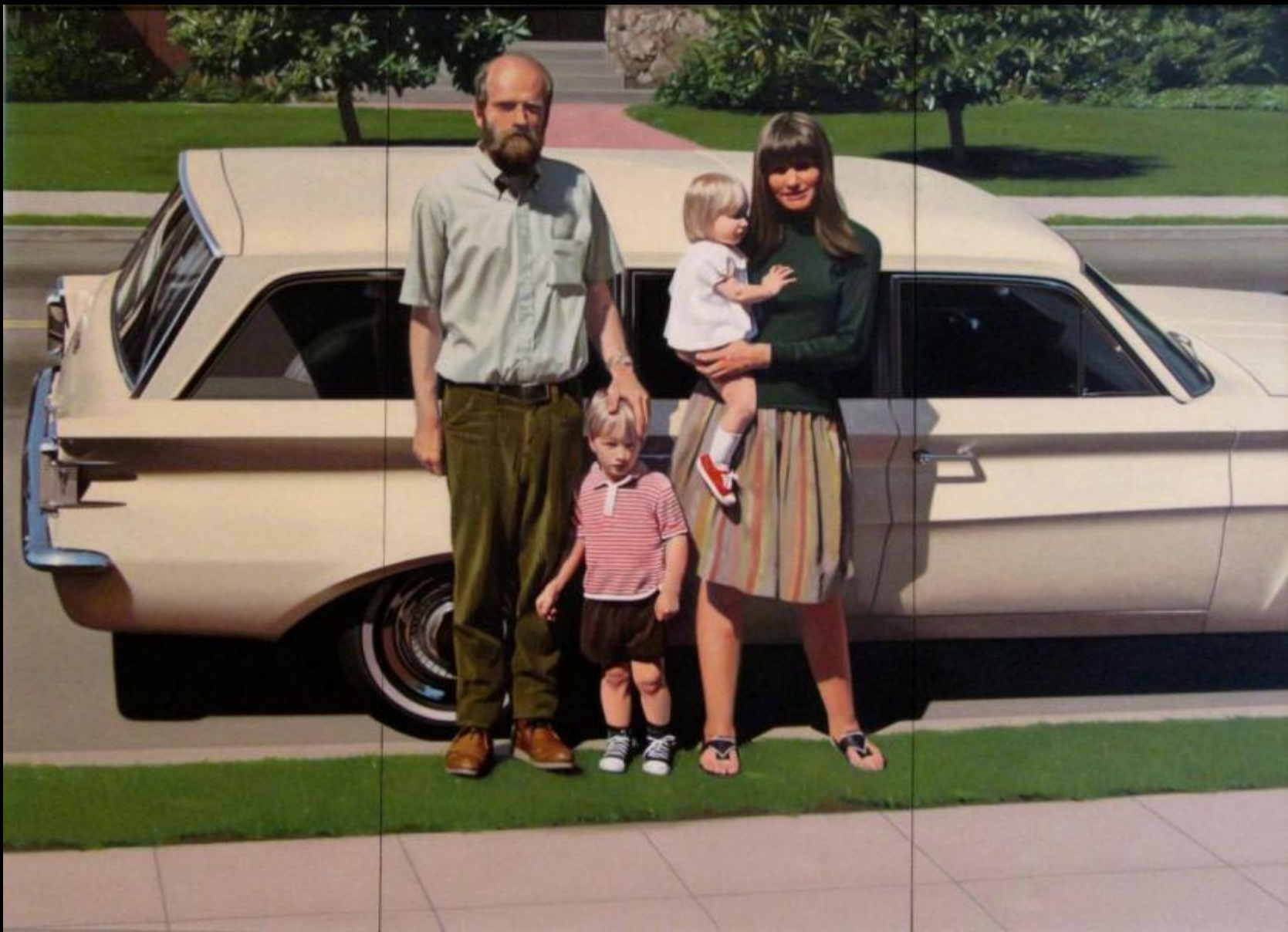
Роберт Бектл. Понтиак '61. 1968–1969 годы © Robert Bechtle / Whitney Museum of American Art