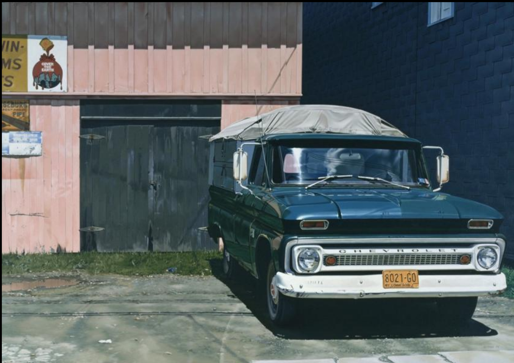
Ральф Гоингс. Шевроле Sherwin Williams. 1975 год © Ralph Goings / MoMA