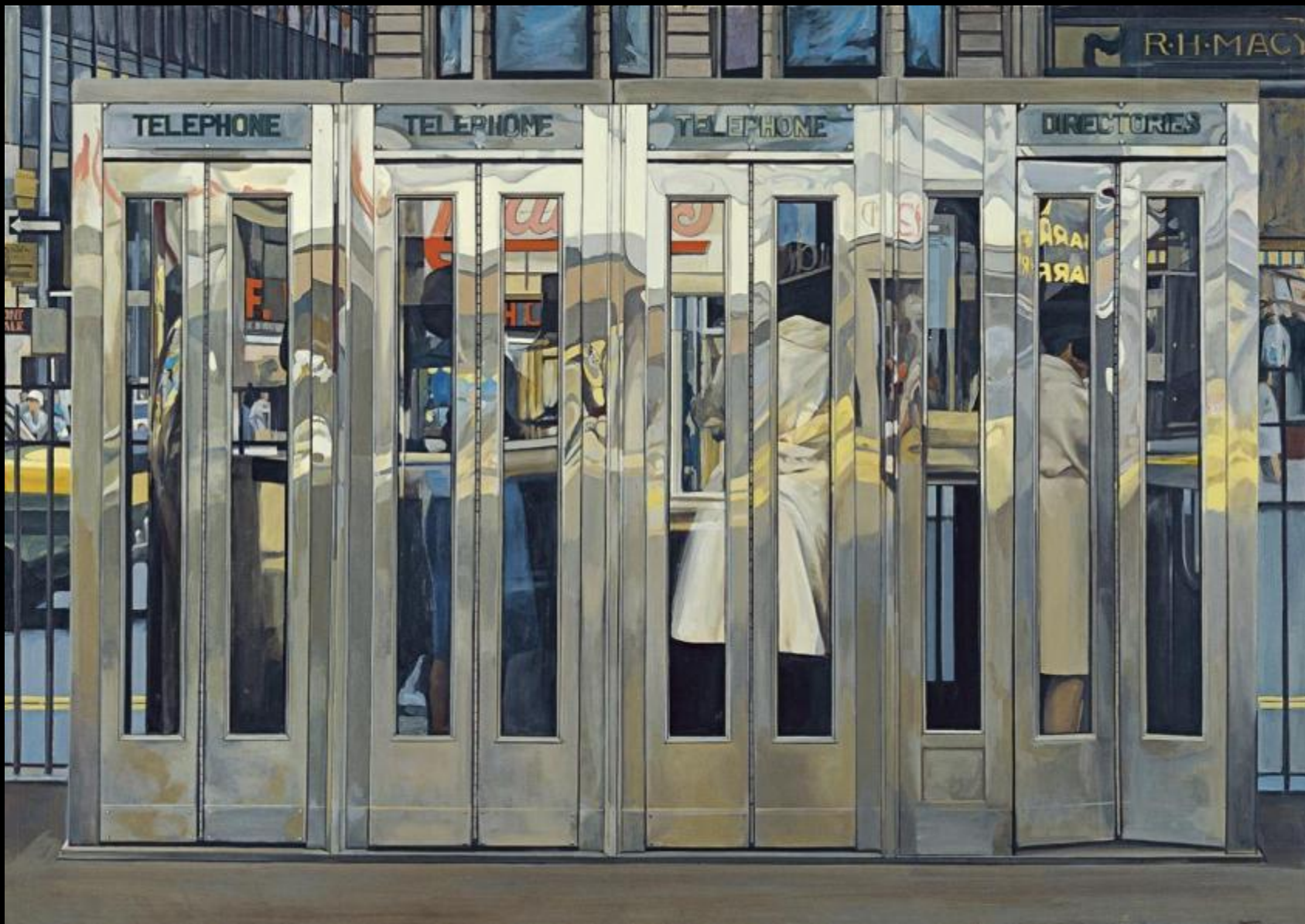
Ричард Эстес. Телефонные будки. 1967 год © Richard Estes / Museo Thyssen-Bornemisza