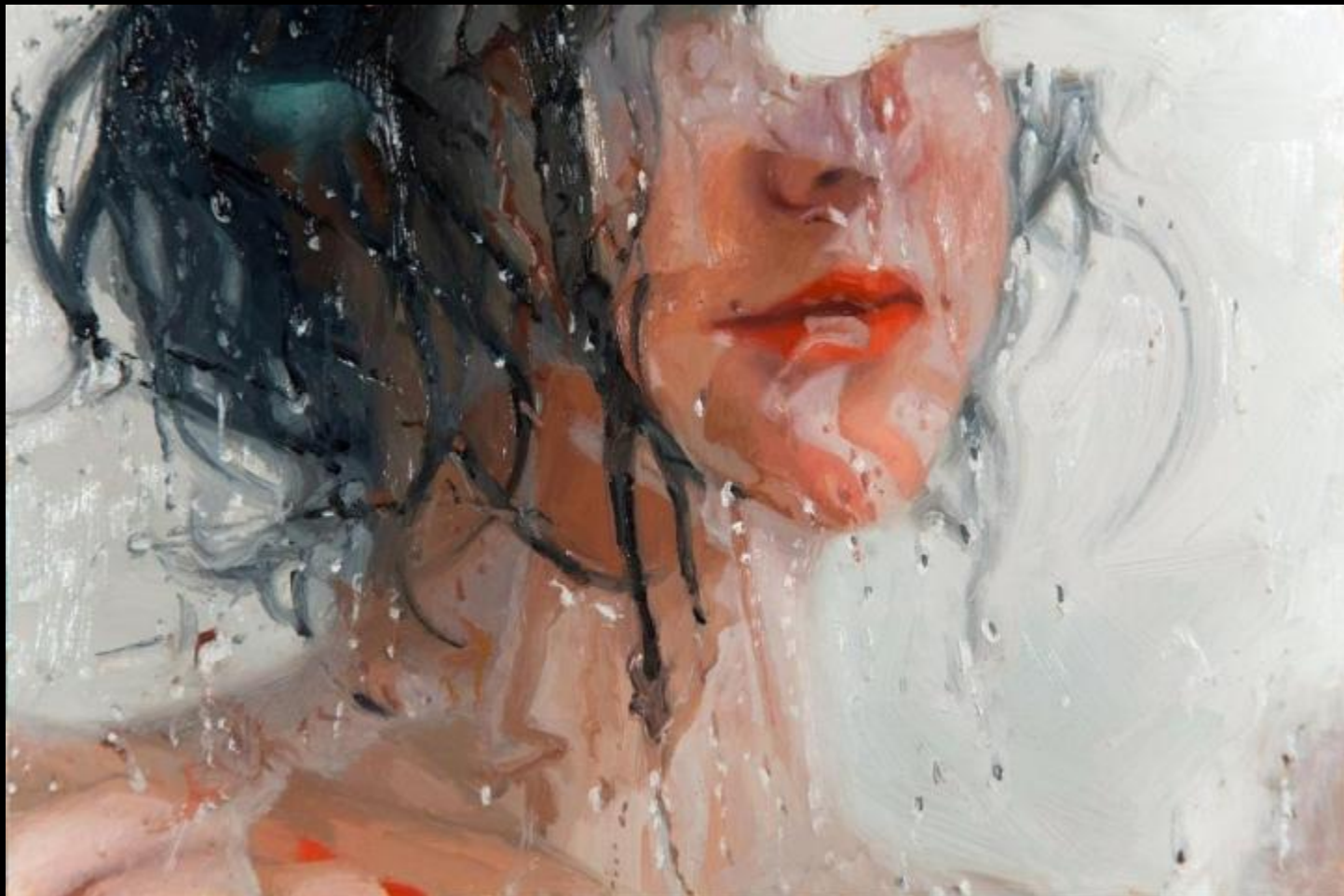
Американская художница Алисса Монкс