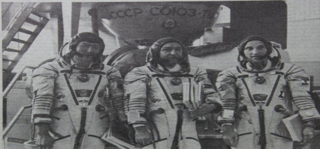
Члены советско-австрийского экипажа (слева направо): Т. О. АУБАКИРОВ, А. А. ВОЛКОВ, Ф. ФИБЕК.

Касаясь перспектив казахстанской космонавтики, Аубакиров призвал весь народ республики, всех проживающих на земле Казахстана поддерживать развитие космической науки на Байконуре. Много хорошего сказал Тохтар в конце этого неожиданного экспресс-интервью о своем да-