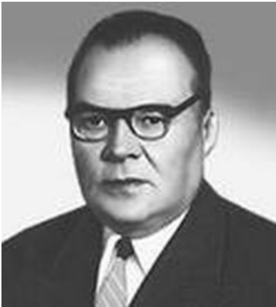
Николай Васильевич Томский