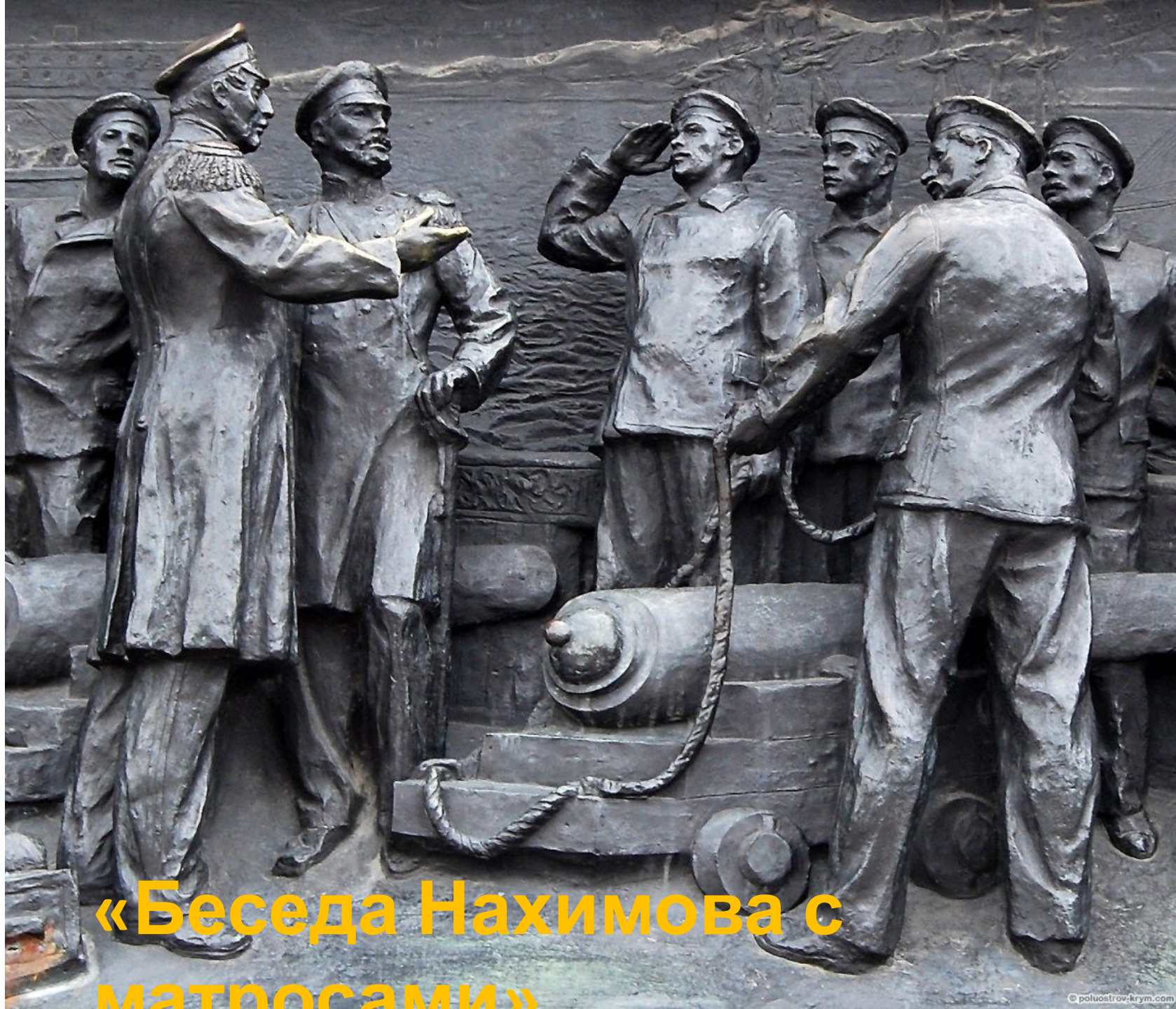
«Беседа Нахимова с матросами»