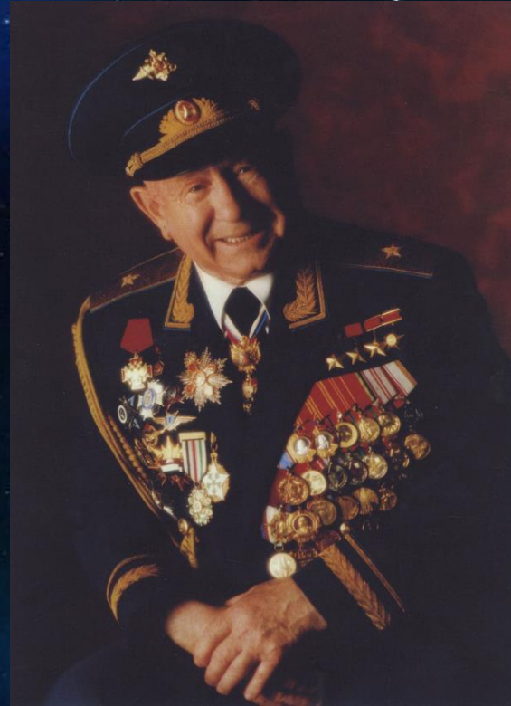
Парадная форма генерал-майора авиации А.А. Леонова