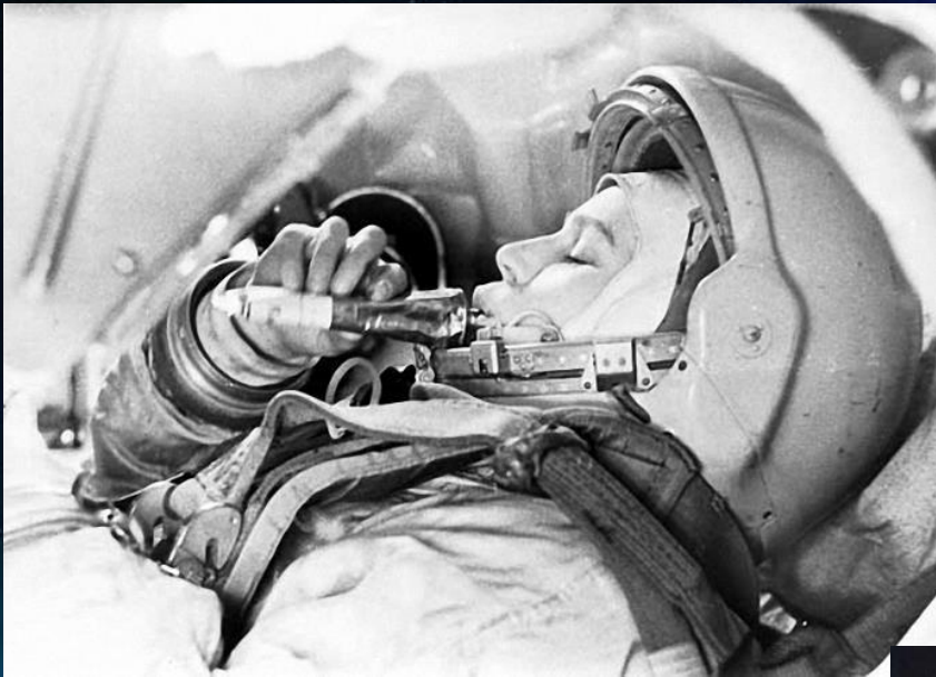
Бортовой холодильник БХ-2

В 60-е годы для космонавтов придумали тубики, из которых выдавливали не только желе, соки, но даже мясо, картофельное пюре, овощи, супы и борщи.