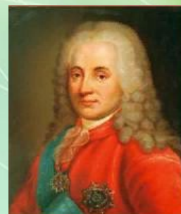
Д. М. Голицын – действительный тайный советник, президент Камер-коллегии