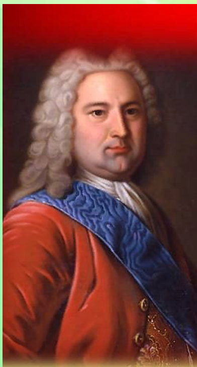
БИРОН Эрнст Иоганн – обер-камергер [1730–40], герцог Курляндии [1737–40], фаворит Анны Ивановны

Период правления Анны Иоанновны (1730-1740 годы) называют «Бироновщина». Это название логично, поскольку всеми делами в стране заправлял фаворит императрицы Эрнст Иоганн Бирон.