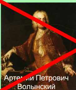
Арте́ми Петро́вич Вольны́й