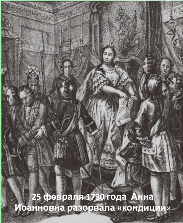
25 февраля 1730 года Анна Иоанновна разорвала «кондиции»

Первая попытка ограничения самодержавия, но ограничение не законом, а волей нескольких кланов.