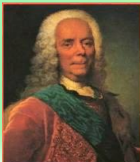
В. В. Долгоруков – генерал-фельдмаршал