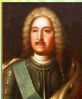
М. М. Голицын – генерал-фельдмаршал, президент Военной коллегии