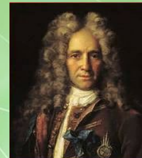
Г. И. Головкин – канцлер, президент Коллегии иностранных дел