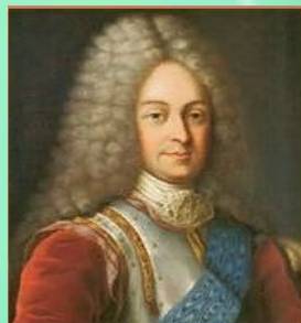
В. Л. Долгоруков – действительный тайный советник