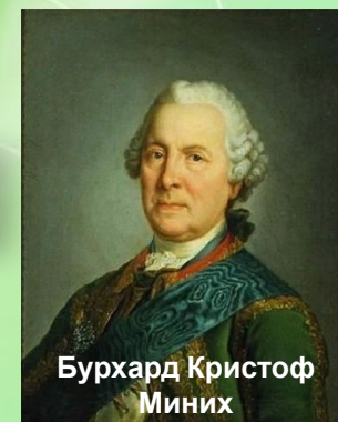
Бурхард Кристоф Миних

Указ о «верноподданных» мастеровых (1736 г.)