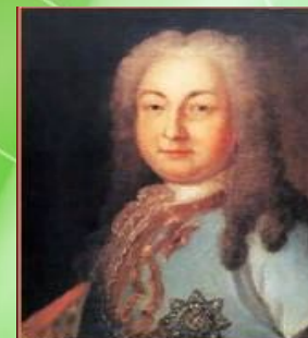
А. И. Остерман – вице-канцлер, президент Коммерц-коллегии