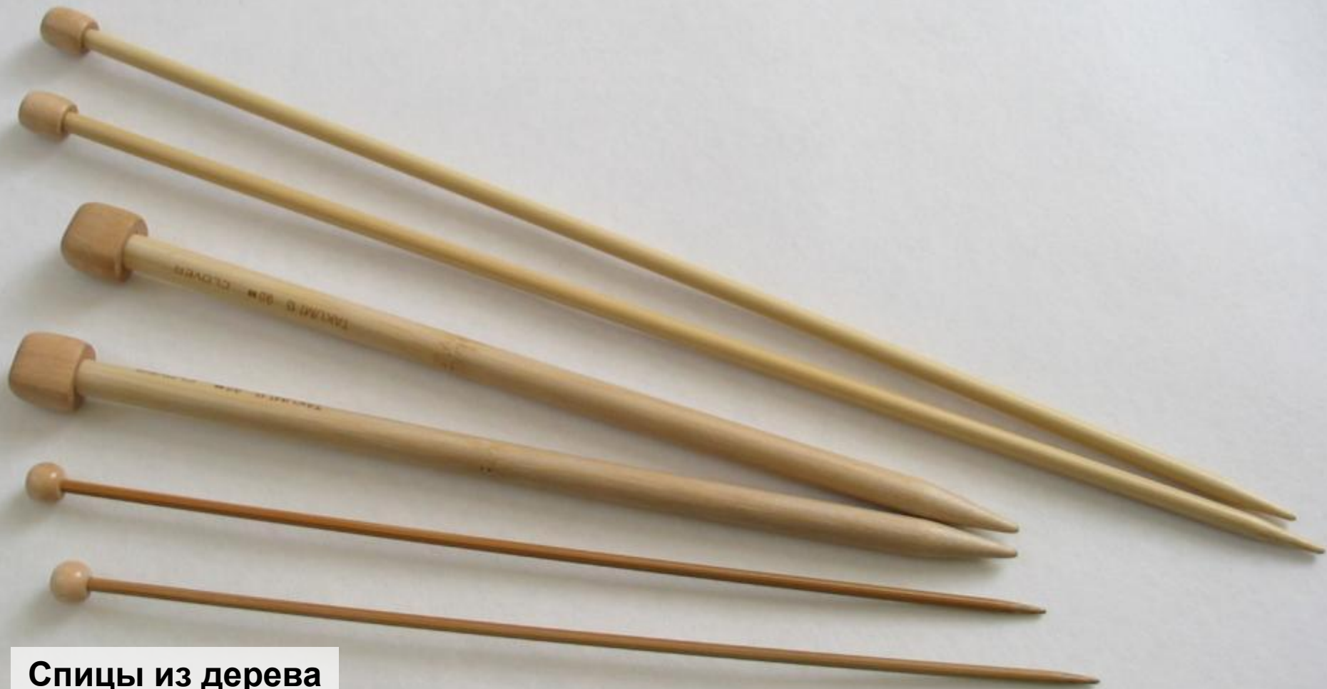
Спицы из дерева