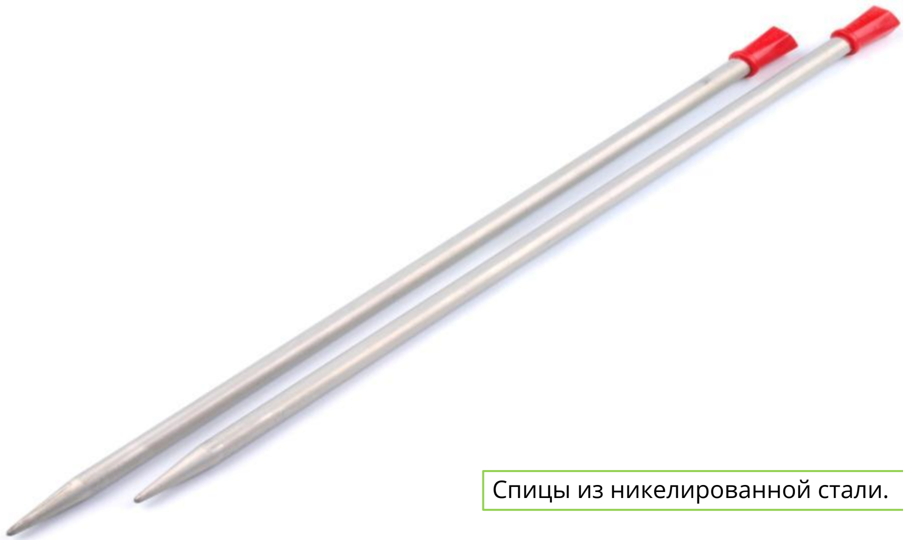
Спицы из никелированной стали.