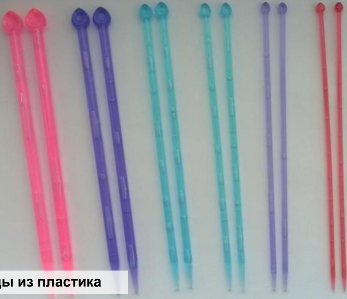
Спицы из пластика