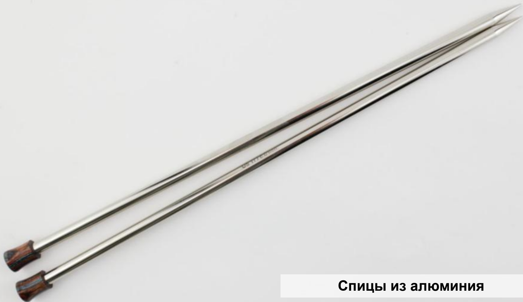
Спицы из алюминия