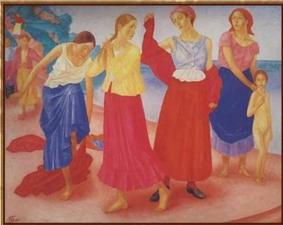
К.С. Петров-Водкин «Девушки на Волге»

В советский период само понятие «светской жизни» отменяется. Дворян уничтожают, их привычки и обычаи высмеивают и искажают. Нарочитая грубость обращения считается признаком пролетарского происхождения, вместе с тем разного рода начальники теперь неизмеримо больше дистанцируются от подчиненных, чем прежде.