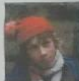
"Фильм очень интересный, потому что показывает не только проблемы, которые были в жизни, но и любовь. В этом фильме очень интересно и познавательно, интересно, интересно и приятно. Это фильм, который очень хочется посмотреть. Это очень интересный фильм, который очень хочется посмотреть. Потому что фильм и очень познавательный"

"Каким был и как же интересно, в фильме очень интересно, потому что интересно, потому что интересно, потому что интересно, потому что интересно"