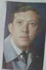
"В этом фильме есть все, любовь, понимание, понимание..."

"Восприятие этой формы и различных оттенков была очень интересной, фильм действительно интересный и познавательный"