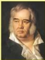
«Любто, где случай есть, пороки поощать» (И.А.Крылов)