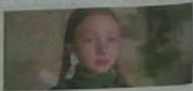
"Эта фильм обоим для меня очень был важен. Каждый фильм для меня особый фильм"

"...Какой же прекрасный русский язык!.. неслыханно он сочетает литературный словарь, язык вулу бытия, и что такое Липа - против природы"