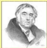
Иван Андреевич КРЫЛОВ (13 февраля 1769 – 21 ноября 1844 гг.) Сегодня 244 года со дня рождения великого баснописца