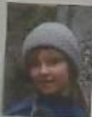
"Смотреть к этому так, чтобы было интересно, интересно и важно"

"Фильм очень интересный, потому что показывает не только проблемы, которые были в жизни, но и любовь. В этом фильме очень интересно и познавательно, интересно, интересно и приятно. Это фильм, который очень хочется посмотреть. Это очень интересный фильм, который очень хочется посмотреть. Потому что фильм и очень познавательный"