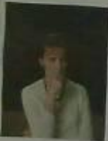
"Обоим видео интересна картина"