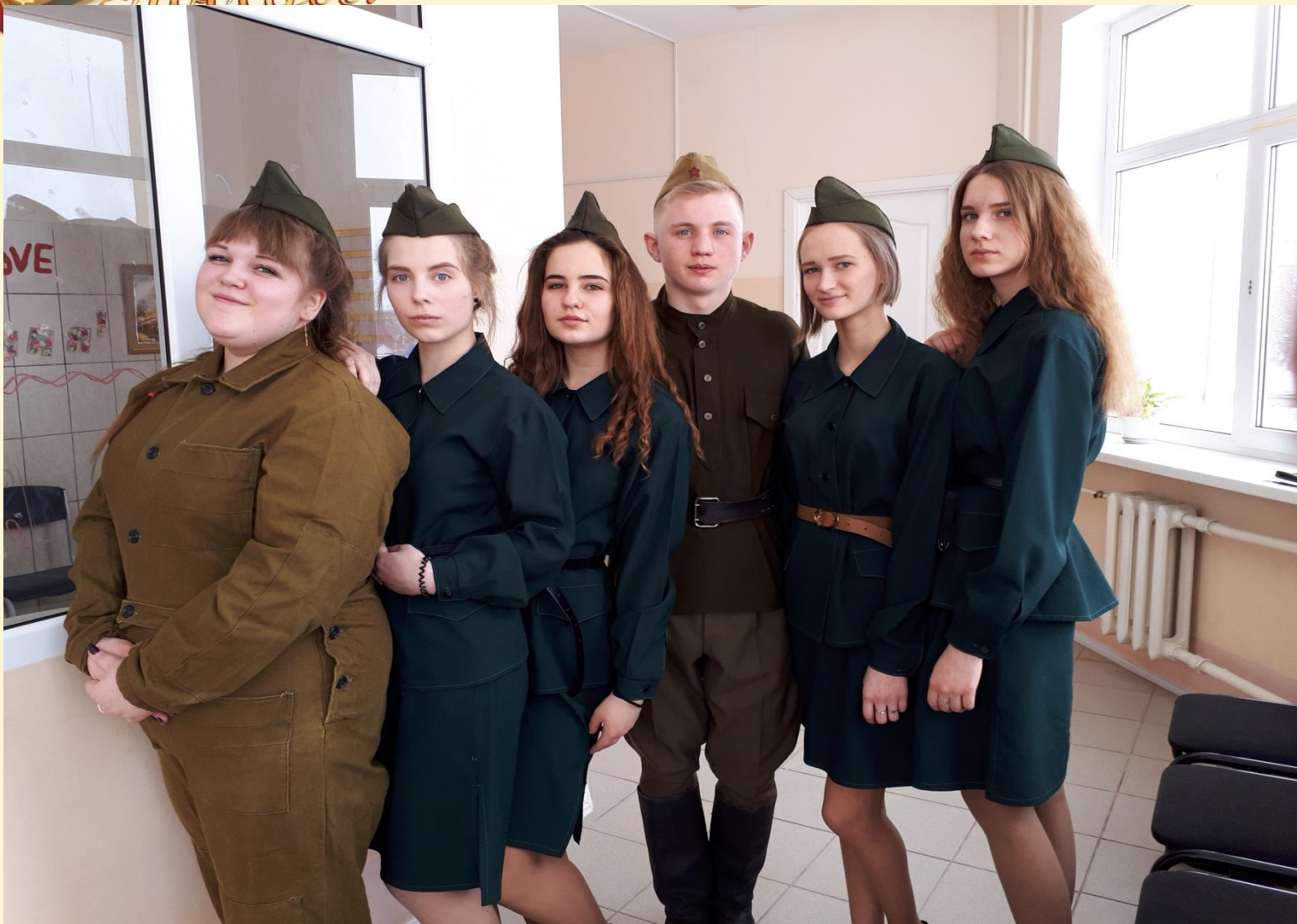
Театрализованное представление на тему ВОЙНЫ