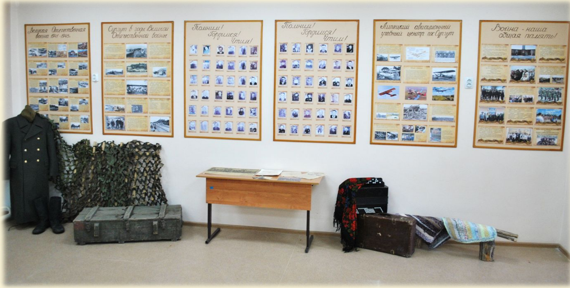
Экспозиция «Великий подвиг Великого народа»

Страницы истории подвига народа в годы Великой Отечественной Войны размещены в экспозиции школьного музея ГБОУ СОШ пос. Сургут.