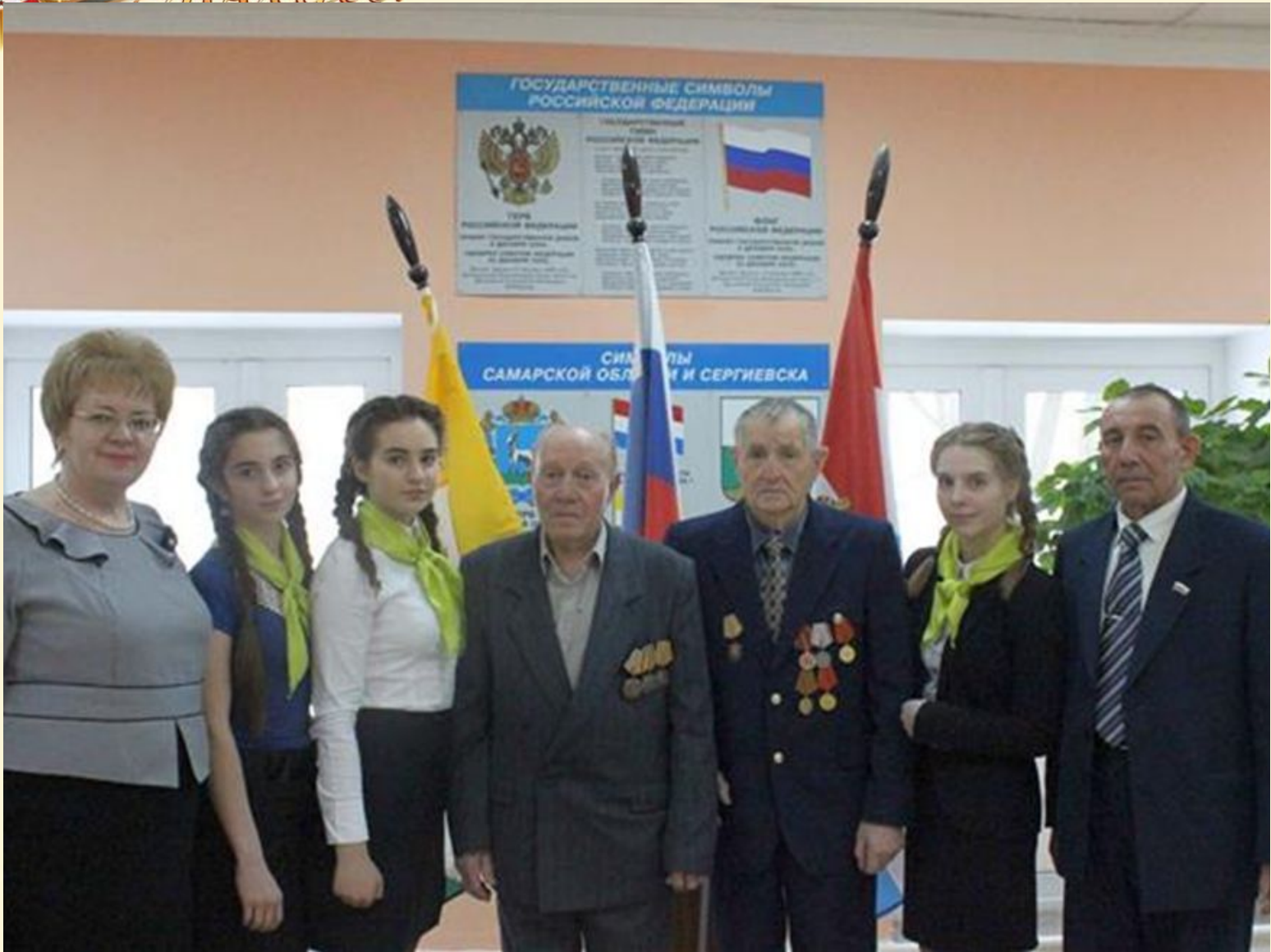
Встреча с ветеранами ВОВ