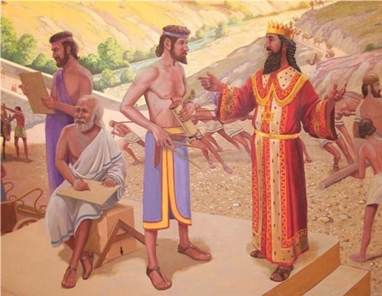
Строительство храма царя Соломона

В Ветхом Завете рассказывается об Аврааме – патриархе семитских племён, о переходе евреев через Красное море во время побега из египетского рабства, о пророке Давиде, о постройке храма царём Соломоном, о пророках Исае, Иеремие, Ионе, Илие, Елисее, Данииле, о предсказании прихода в мир Спасителя.