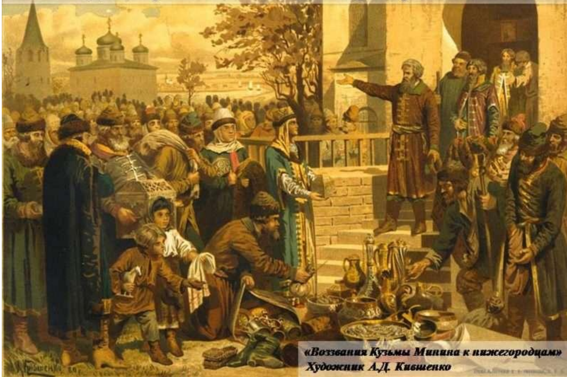
«Воззвания Кузьмы Минина к нижегородцам» Художник А.Д. Кившенко