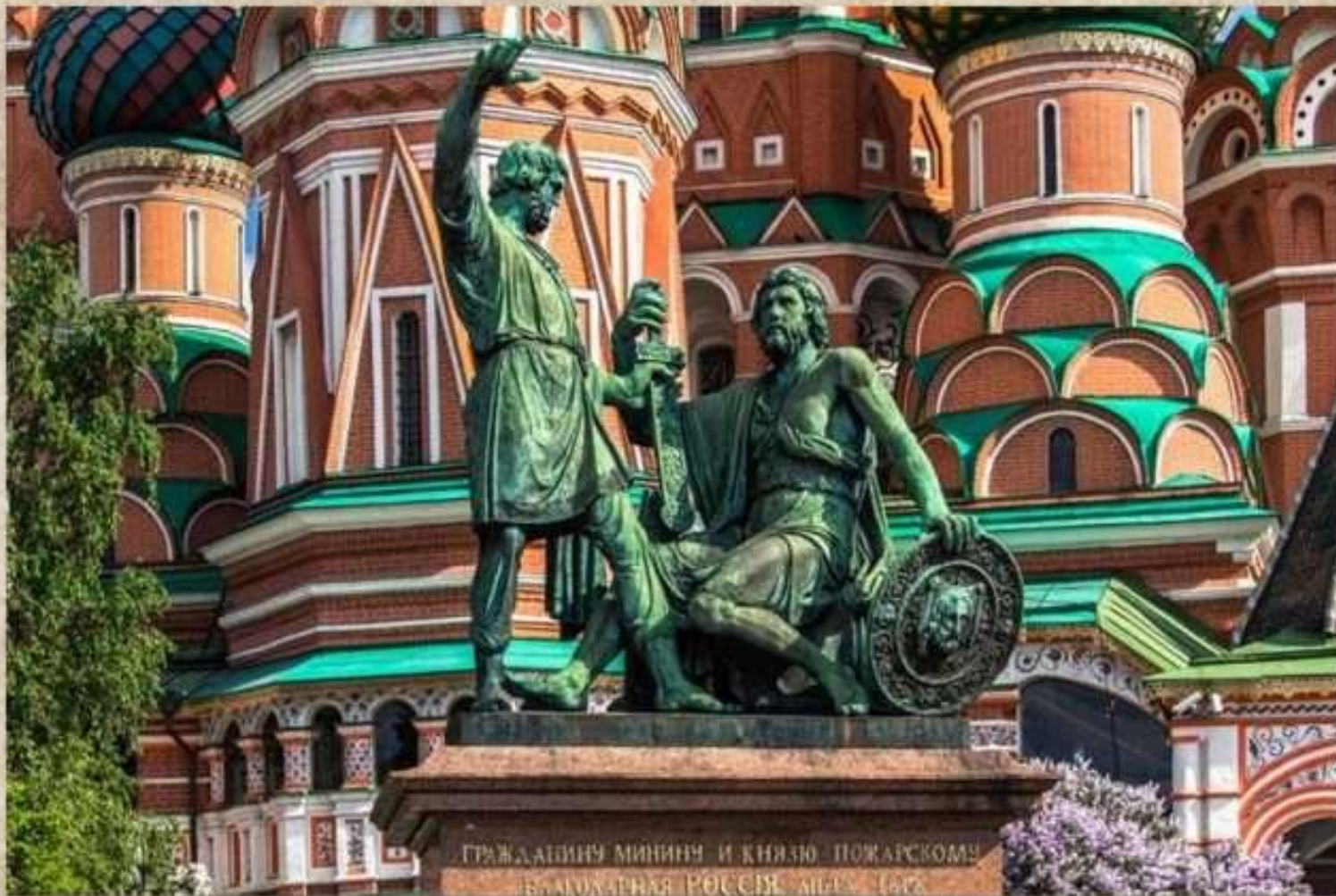
Памятник Минину и Пожарскому, 1818г. «Князю Пожарскому и гражданам Минину благодарная Россия. Лета 1818 года». И. Матрос