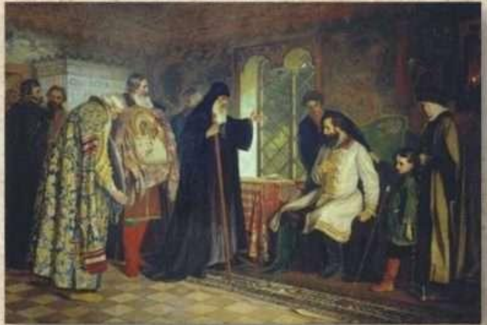
«Нижегородские послы у князя Дмитрия Пожарского». Художник В.В. Савинский, 1882

По предложению Минина на пост главного воеводы был приглашен 30-летний новгородский князь Дмитрий Пожарский . Пожарский не сразу принял предложение, согласился быть воеводой при условии, что горожане сами выберут ему помощника, который начальствовал бы над казной ополчения. И Минин стал "выборным человеком всею землею". Так во главе второго земского ополчения стали два человека, избранные народом и облеченные его полным доверием.