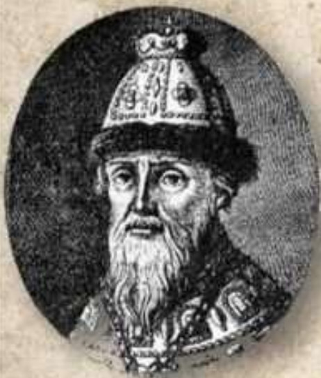
Князь Фёдор Мстиславский

Многим современникам Смуты казалось, что произошло окончательное разорение "пресветлого московского царства". Власть в Москве узурпировала "семибоярщина" во главе с князем Федором Мстиславским, пустившая в Кремль польские войска с намерением посадить на русский престол католического королевича Владислава. В это тяжелое для России время патриарх Гермоген призвал русский народ встать на защиту православия и изгнать польских захватчиков из Москвы. Его призыв был подхвачен русскими людьми. Началось широкое патриотическое движение за освобождение столицы от поляков.