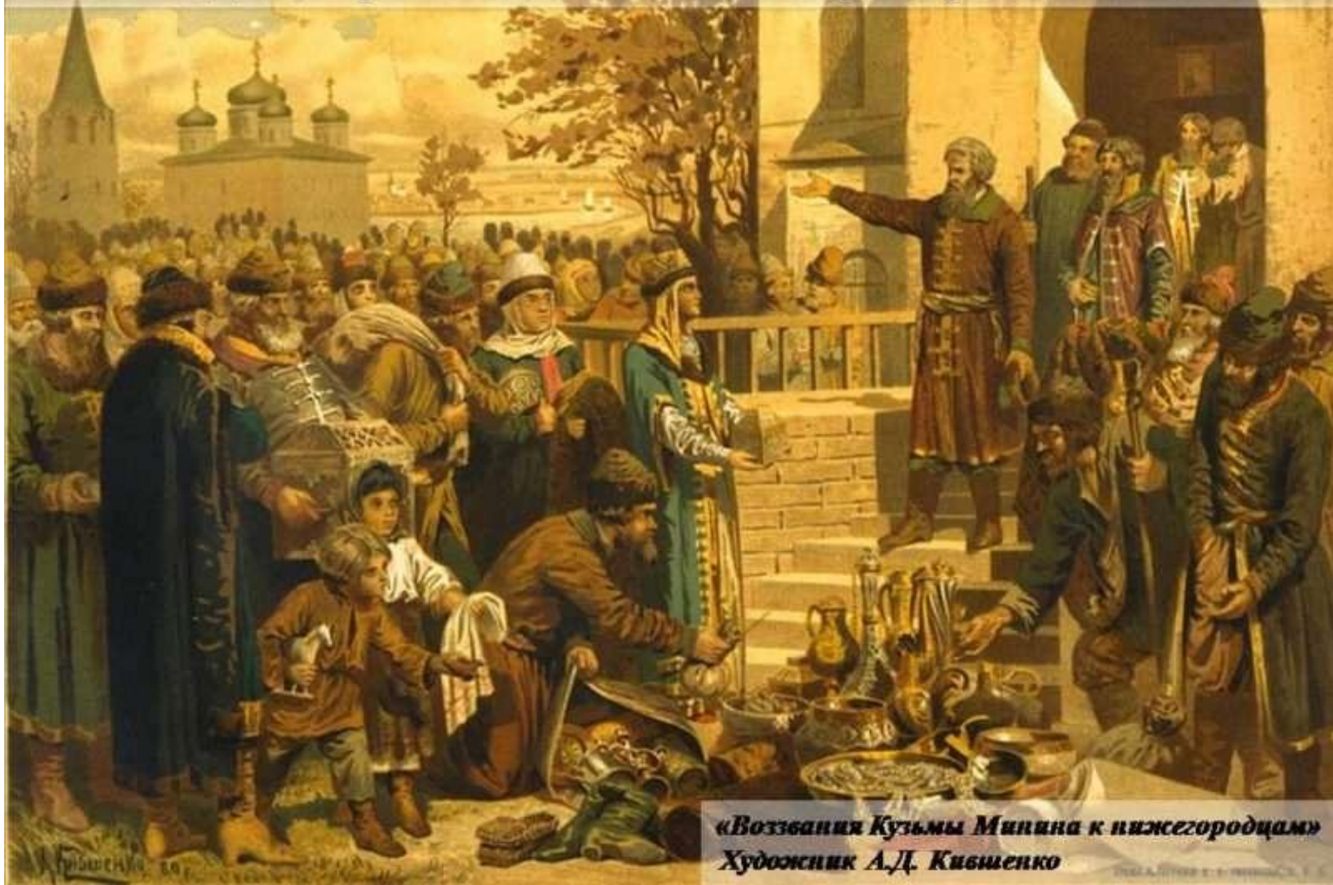
«Воззвания Кузьмы Минина к нижегородцам» Художник А.Д. Кибшенко