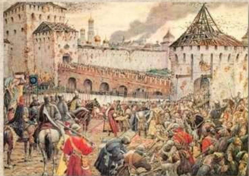
Э. Лиснер. Изгнание польских интервентов из Московского Кремля

Исторически этот праздник связан с окончанием Смутного времени в России в XVII веке. Смутное время - период со смерти в 1584 году царя Ивана Грозного и до 1613 года, - было эпохой глубокого кризиса Московского государства. Единое русское государство распалось, появились многочисленные самозванцы. Повсеместные грабежи, разбой, воровство, повальное пьянство поразили страну.