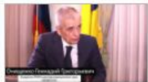
ОНИЩЕНКО ГЕННАДИЙ ГРИГОРЬЕВИЧ Главный государственный санитарный врач России, Академик РАН, доктор медицинских наук, профессор.