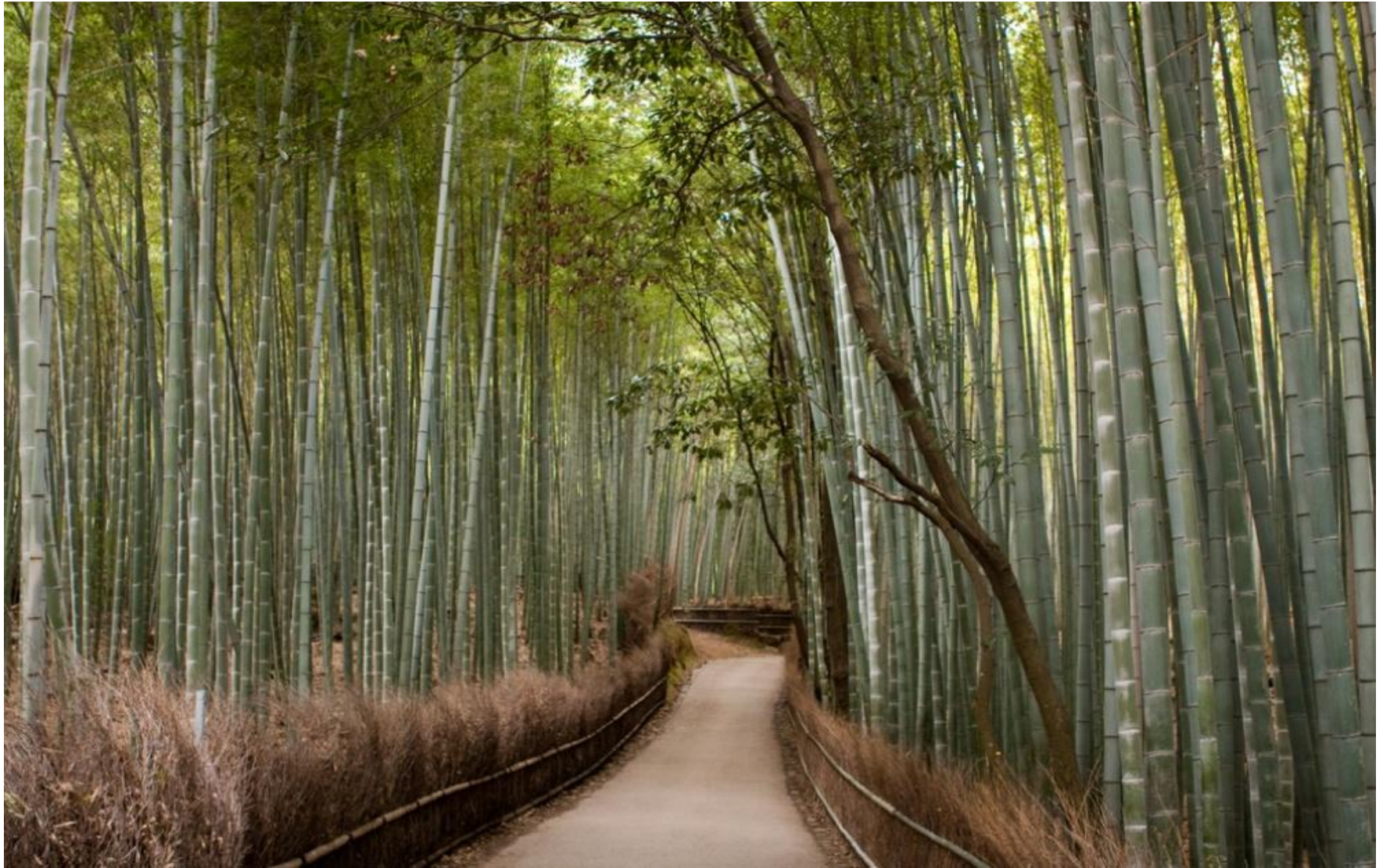
Бамбуковый лес, Киото, Япония