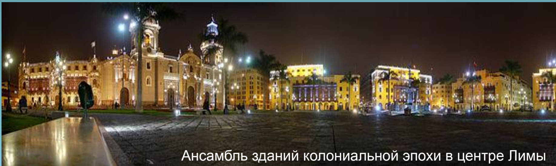
Ансамбль зданий колониальной эпохи в центре Лимы