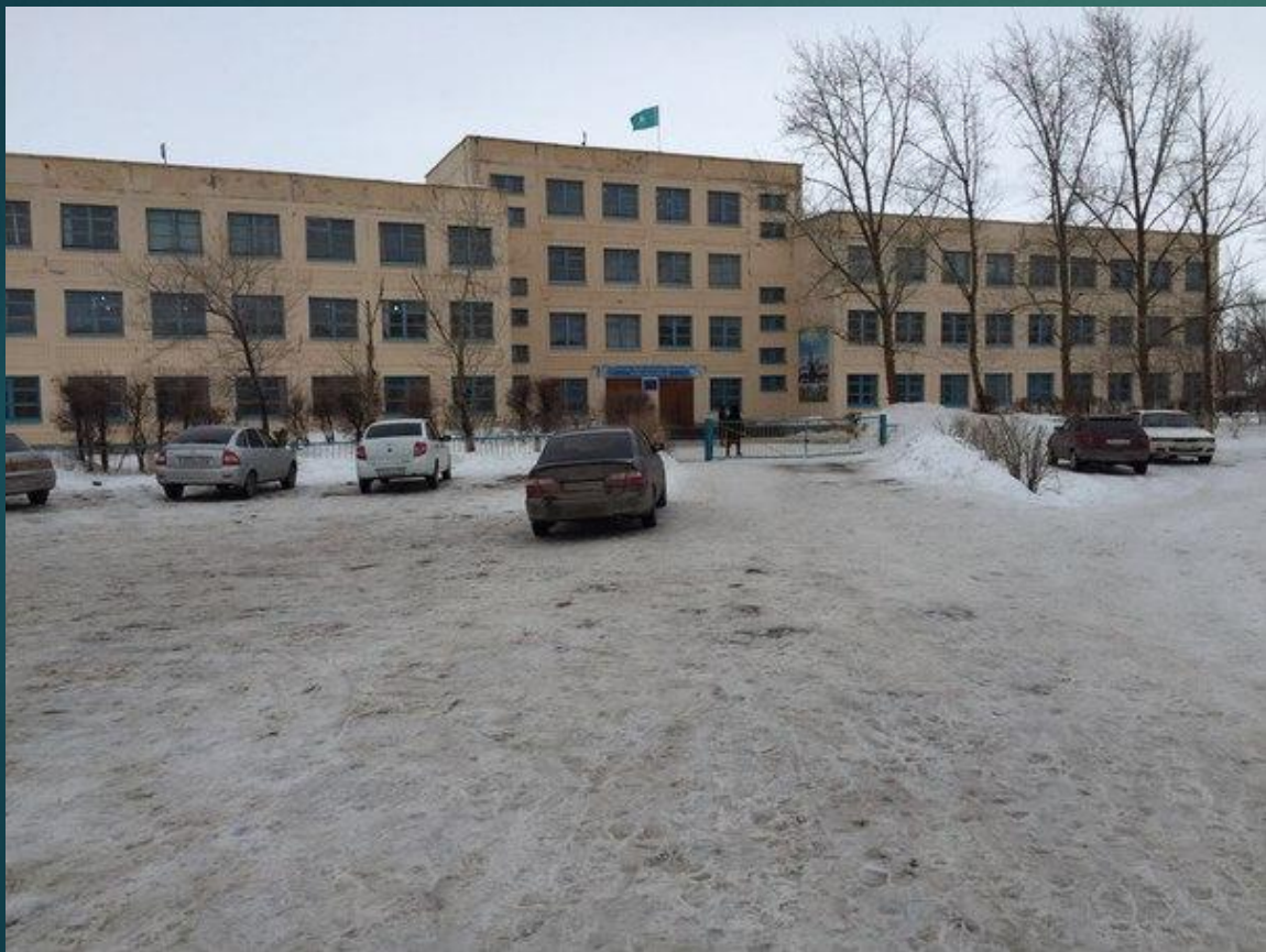
35 школа им М.Арына