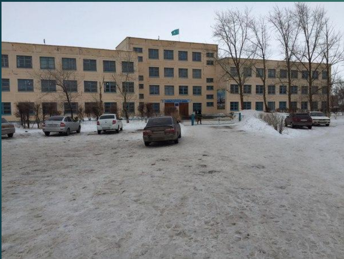
▶ 44 ШКОЛА