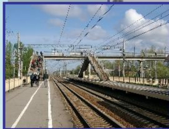
Надземный пешеходный переход