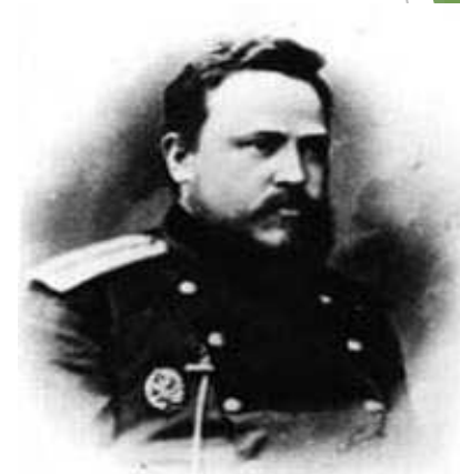
С. И. Мосин