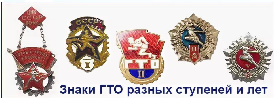
Знаки ГТО разных степеней и лет