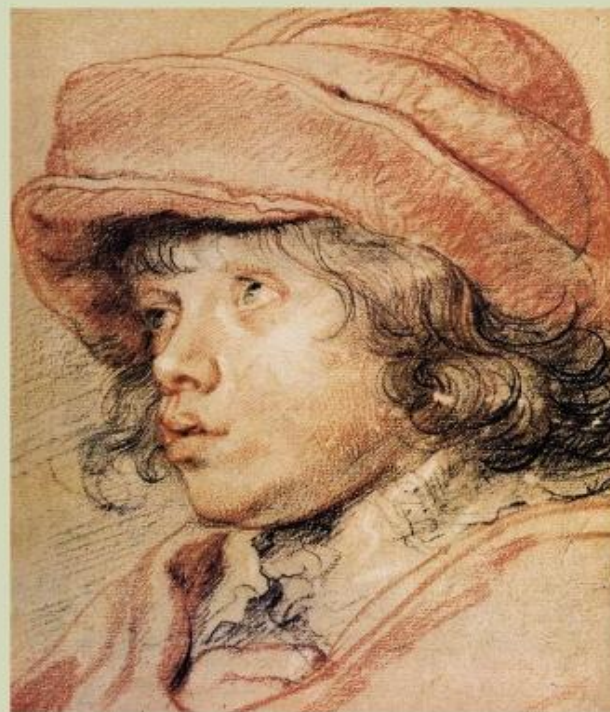
Рубенс Портрет Альберта, сына художника