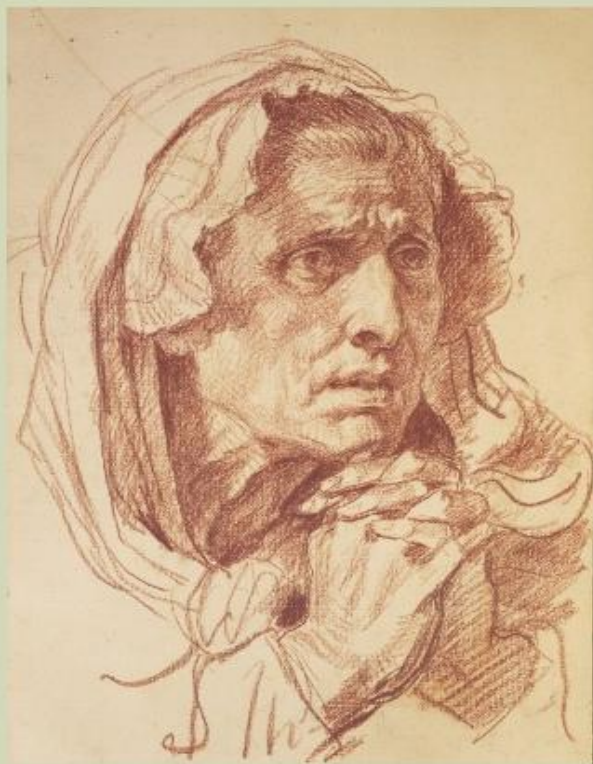
Жан Батист Грёз

Среди цветных графических рисунков художники очень любят сангину. Её красивый красновато – коричневый цвет придаёт рисунку чудесный живописный оттенок.