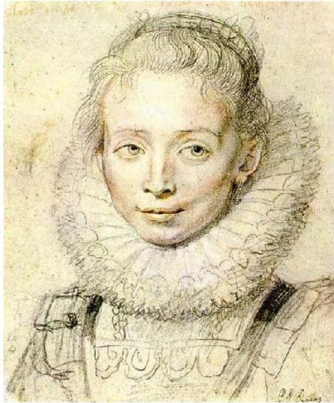
П.П.Рубенс. Портрет Инфанты Изабеллы.

Замечательные графические образы созданы художниками разных времён. Они показывают нам неисчерпаемость выразительных возможностей графики и неистощимое богатство индивидуальности человека, неповторимость каждого момента жизни.