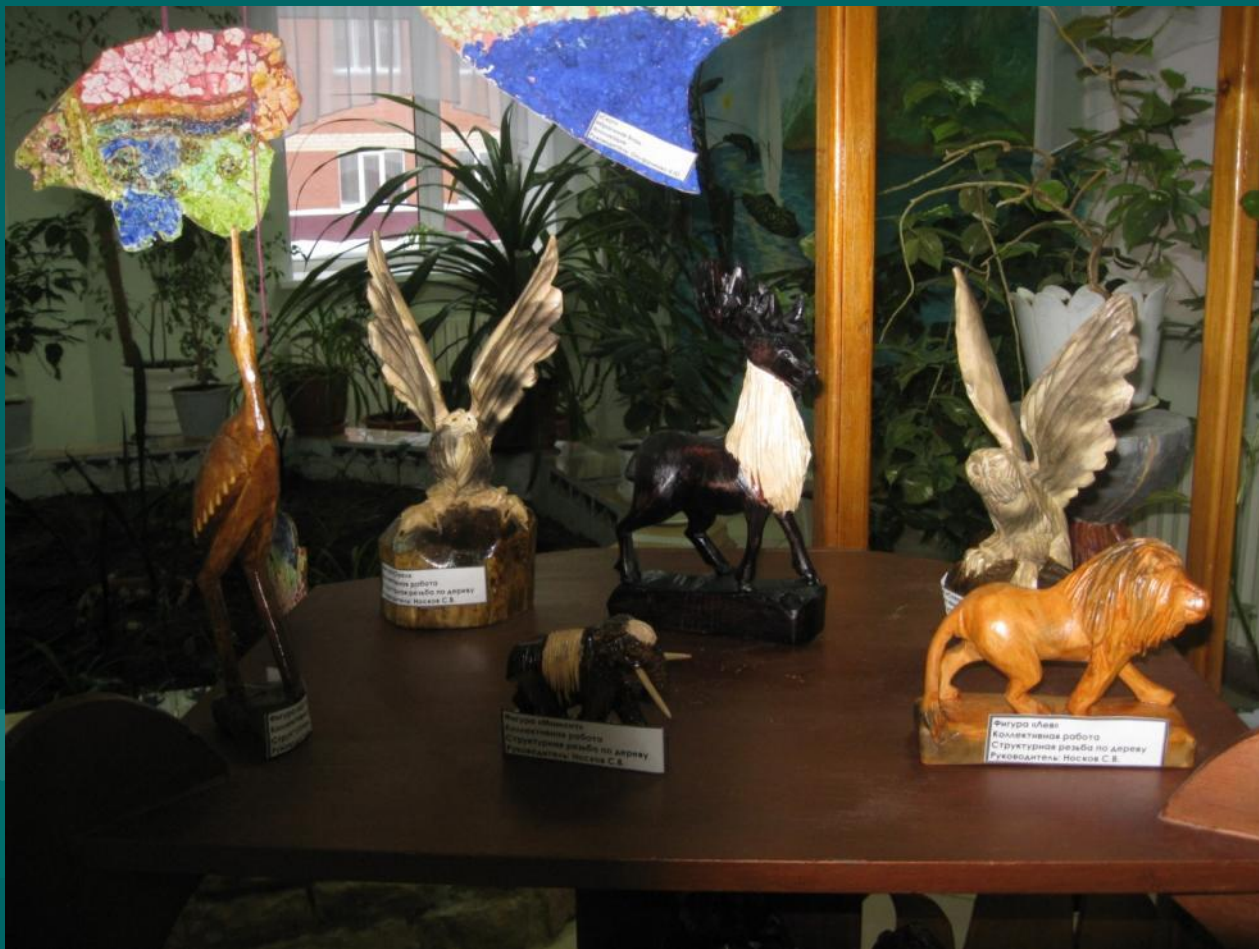
Фигура птицы Коллективная работа Структурная резьба по дереву Режоводители: Москва С.Б.