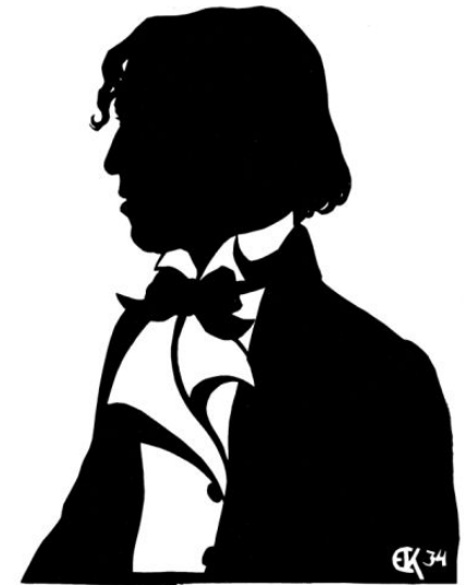
Автопортрет, Силуэт, 1934. Е.С. Кругликова