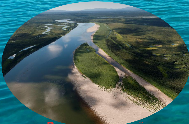
Русло равнинной реки

Русло — Руслом называют углубление, созданное водным потоком, в пределах речной долины. Длина русла соответствует длине реки, ширина различна на разных участках.