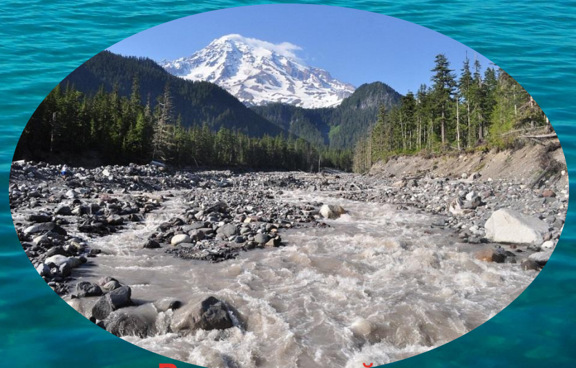
Русло горной реки