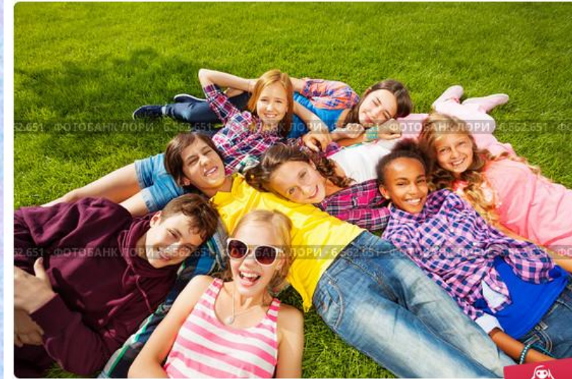
Счастливые подростки - друзья лежат на зеленой траве в парке

Легко или трудно устанавливать контакт, общаться с людьми?