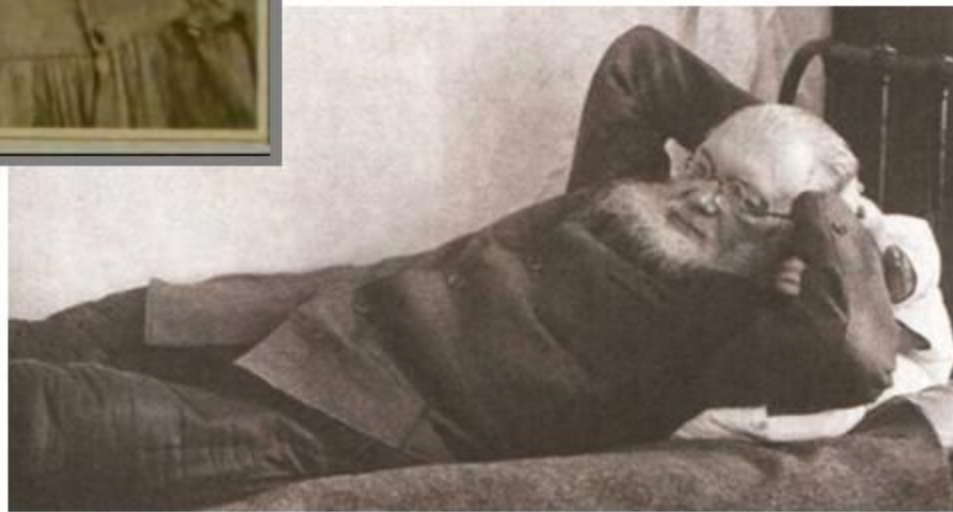
1941 год. Село Большая Мурта, Красноярского края. В ссылке