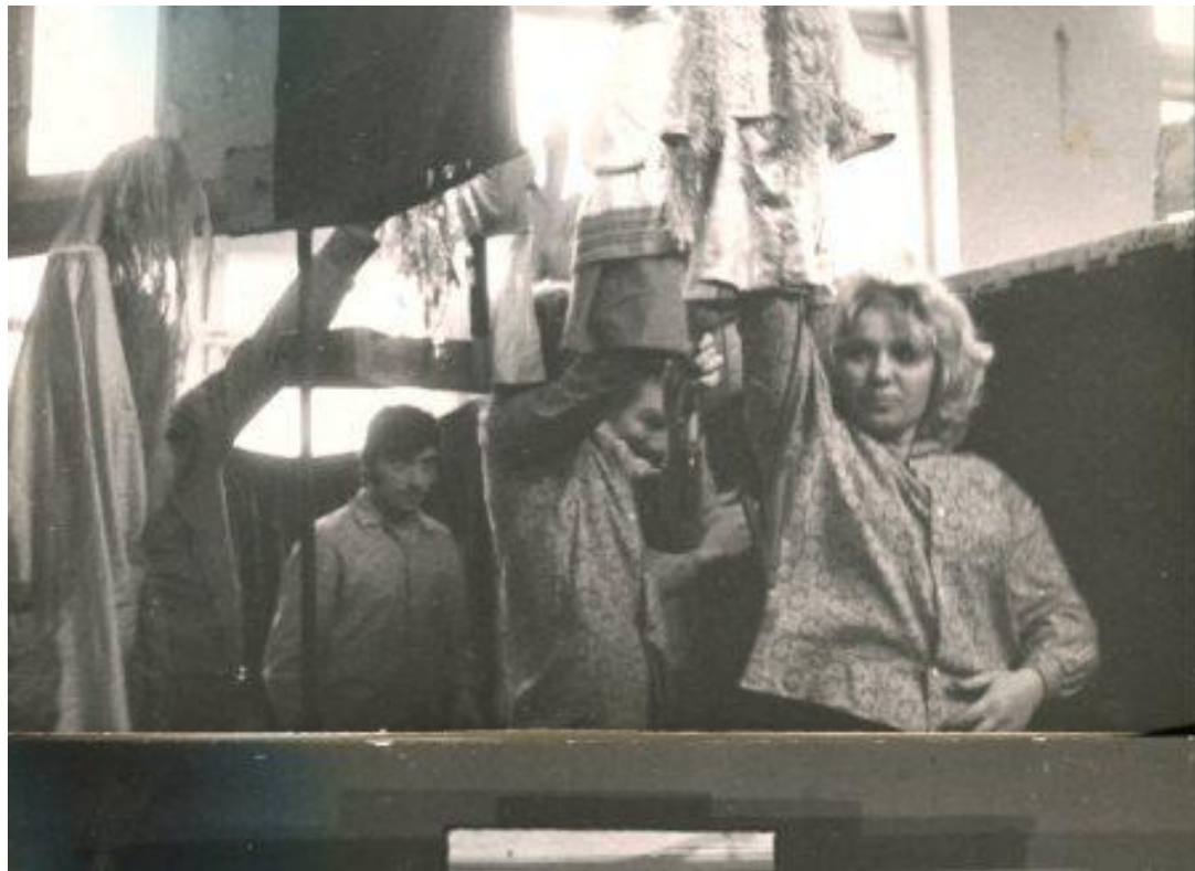
Фото. Репетиция спектакля Республиканского театра кукол МАССР "Повелительница живой воды Ведява"