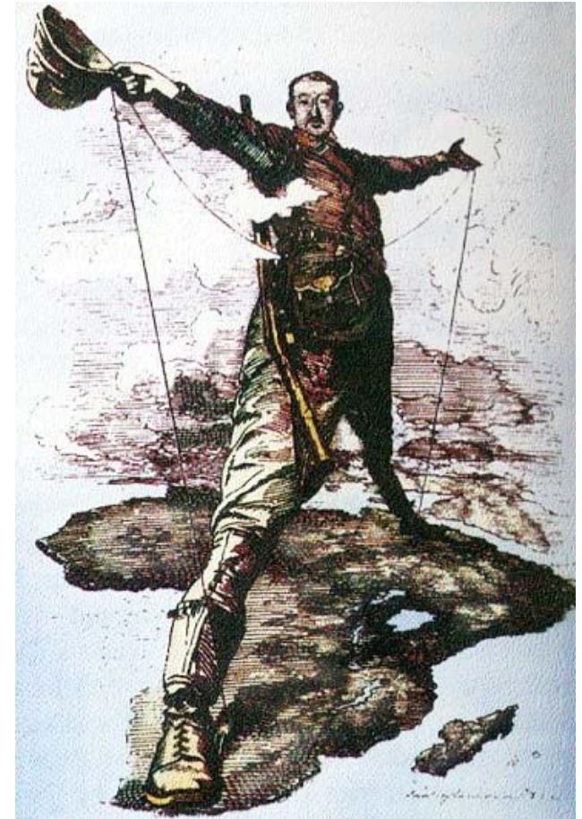
Карикатура на Сесила Родса