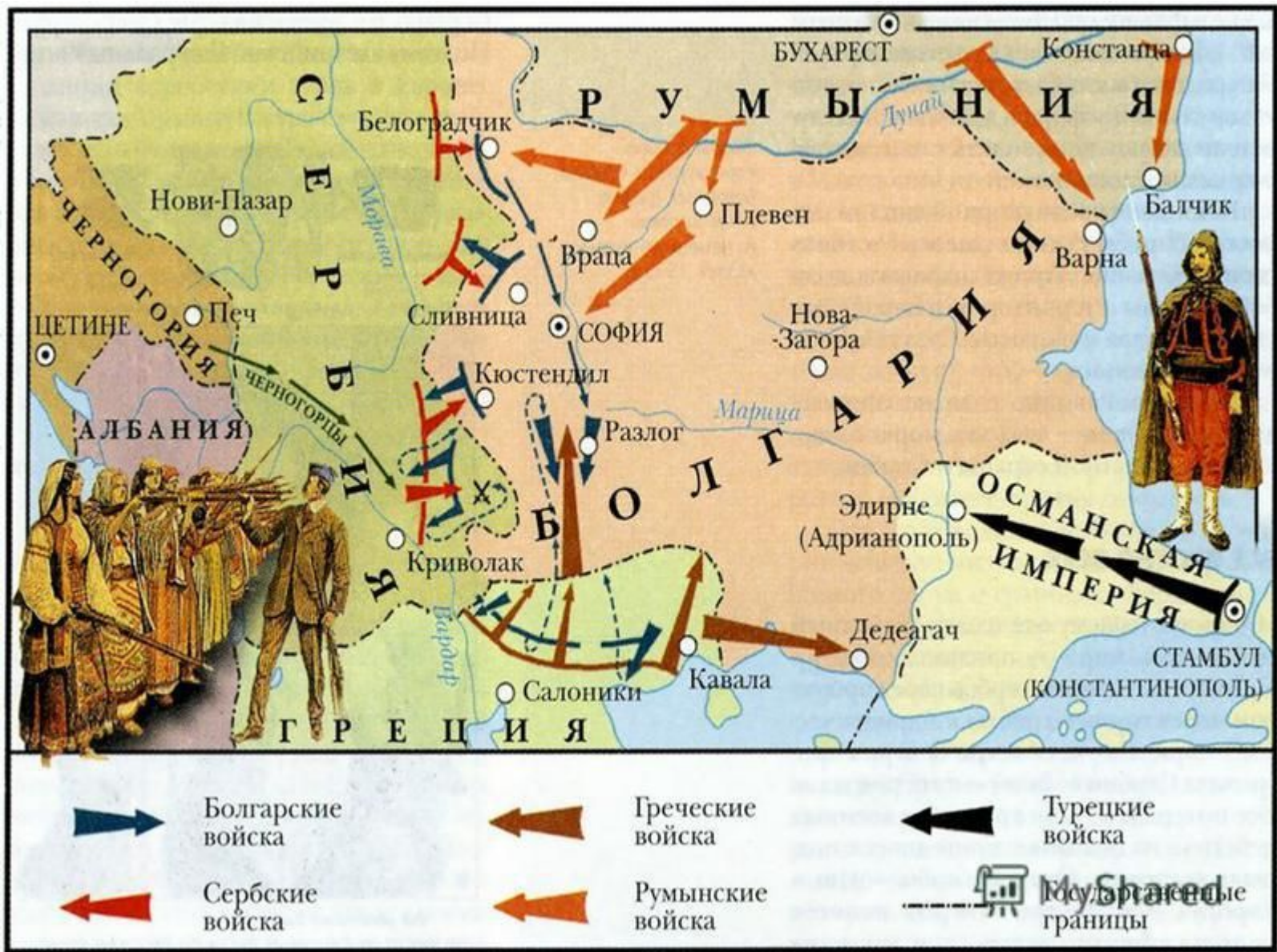
Вторая Балканская война 1913 г.