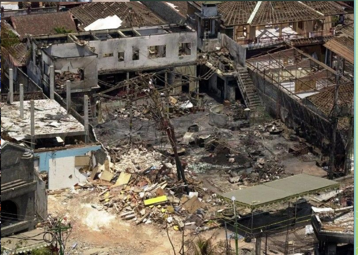
Kuta, Bali 10/12/2002