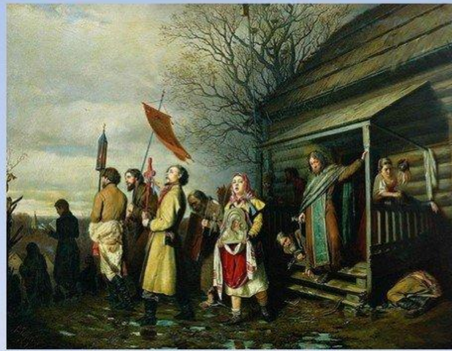
«Сельский крестный ход на Пасхе», 1861