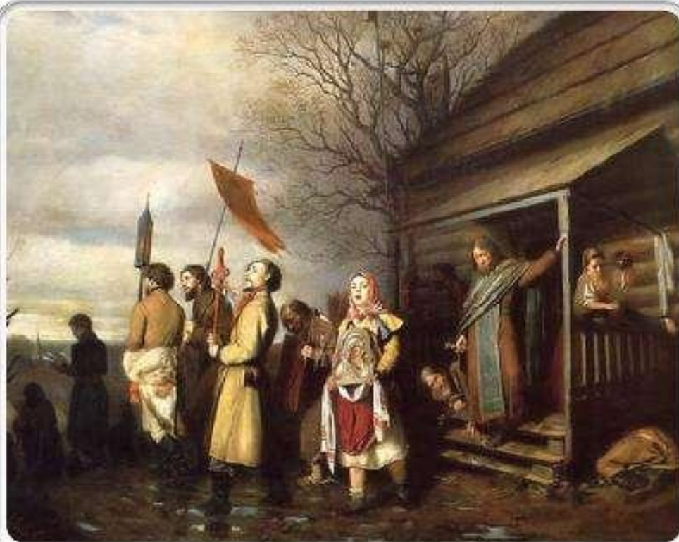
Василий Григорьевич Перов. «Сельский крестный ход на Пасхе». 1861, ГТГ