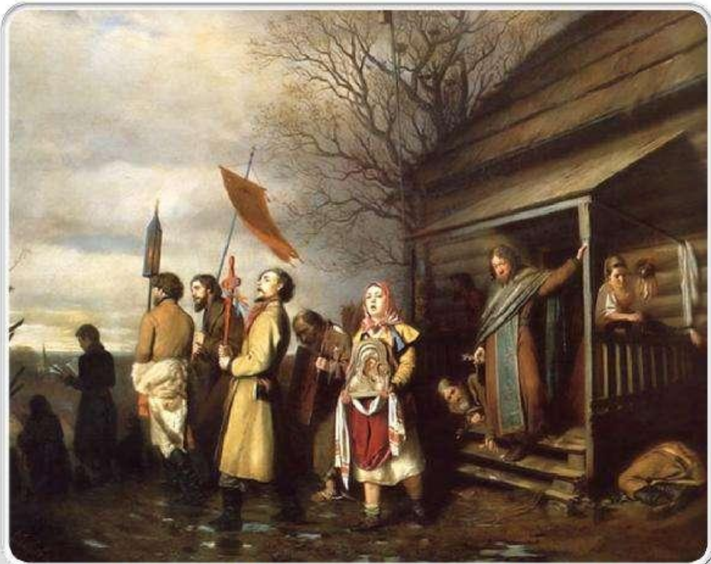
Василий Григорьевич Перов. «Сельский крестный ход на Пасхе». 1861, ГТГ