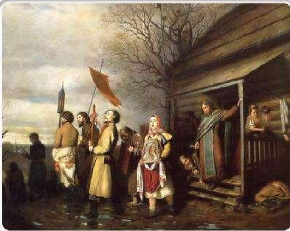
Василий Григорьевич Перов. «Сельский крестный ход на Пасхе». 1861, ГТГ

Московское училище живописи и ваяния времён учения в нём Перова отличалось от Петербургской Академии большой свободой. Это, в частности, выражалось в том, что учащиеся сами могли выбирать темы для «программных» картин. Что и сделал Перов, готовясь участвовать в конкурсе на Большую золотую медаль. Но сформулированный замысел вызвал недоумение в академическом совете и был отвергнут «за непристойное изображение духовных лиц».