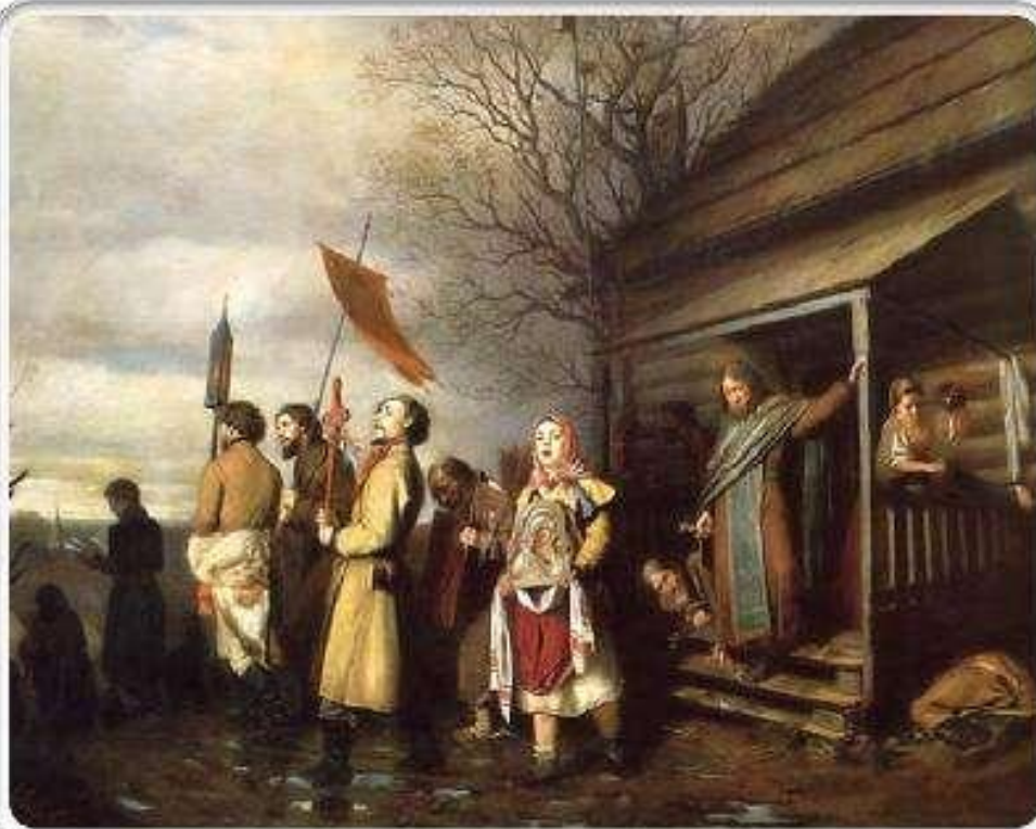
Василий Григорьевич Перов. «Сельский крестный ход на Пасхе». 1861, ГТГ

Перов уступил совету, заменив этот сюжет сюжетом «Проповеди в селе», за которую и получил чаемую награду - она давала право на заграничную пенсионерскую поездку. Но прежнего своего замысла молодой живописец не оставил и ещё до отъезда за границу «Крестный ход» всё-таки написал. Будучи выставленной в 1862 году на постоянной выставке Общества поощрения художеств в Петербурге, картина произвела эффект взорвавшейся бомбы.