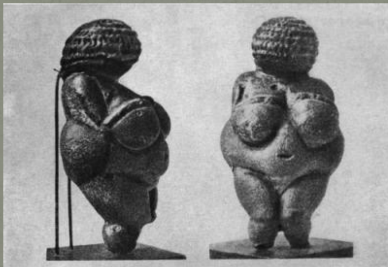
Венера из Виллендорфа. Палеолит. Естественно-исторический музей, Вена