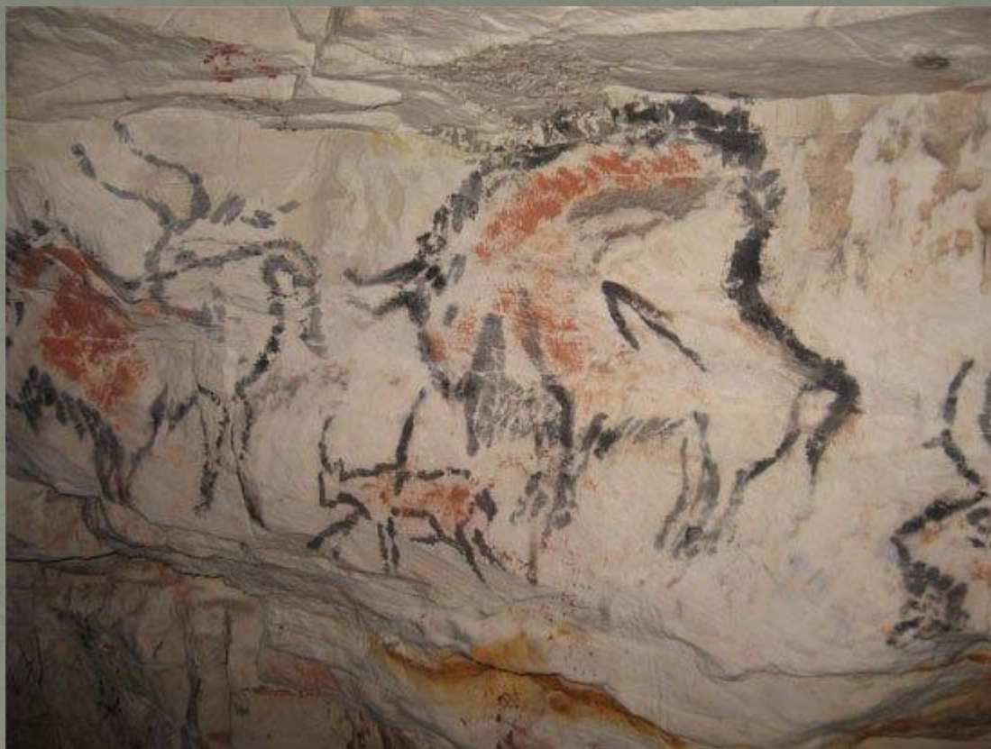
Ка́пова пеще́ра. Живопись