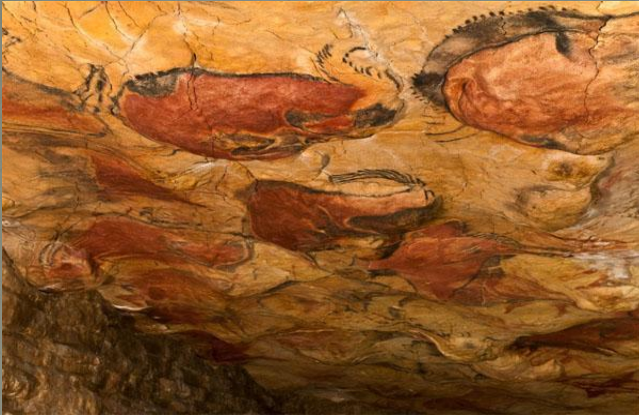
Наскальные рисунки древних людей из пещеры Альтамира