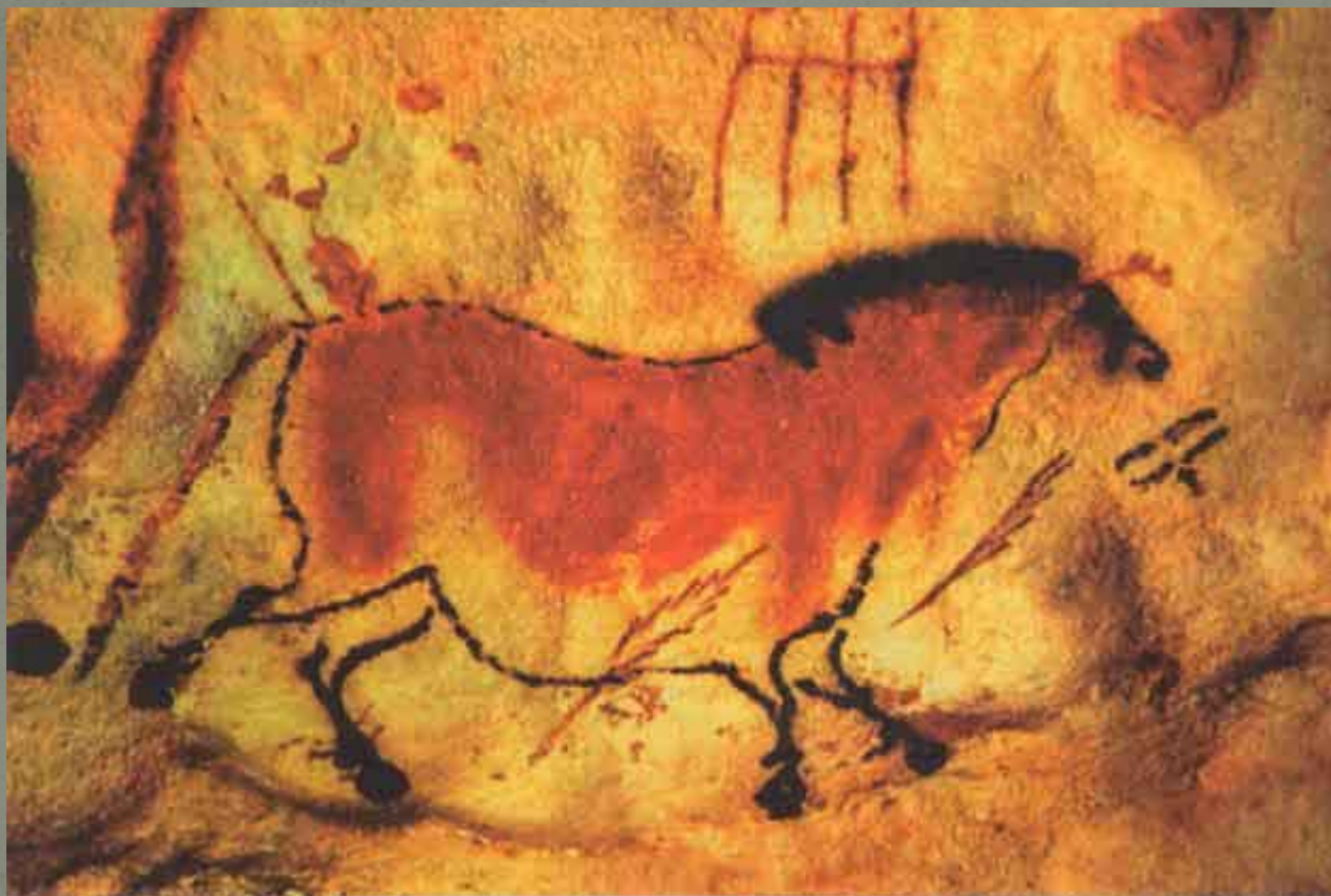
Лошадь. Пещерная живопись. Палеолит