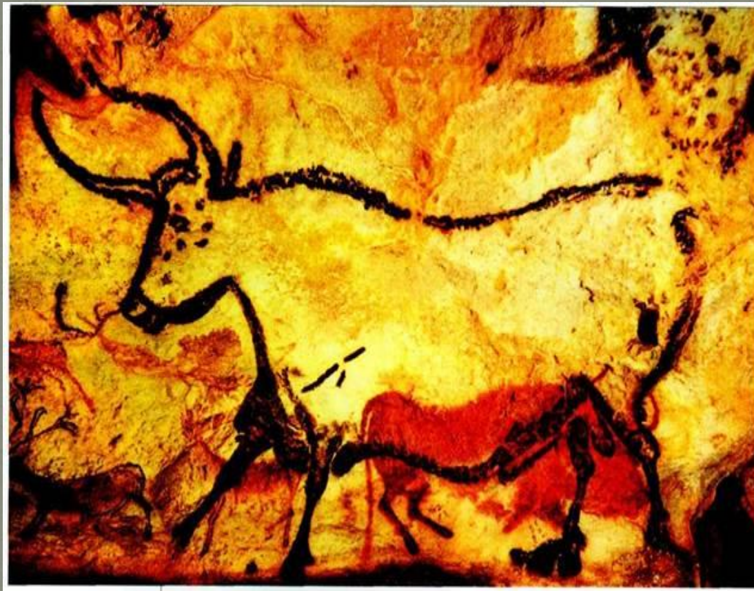
Бык. Палеолит. Пещера Ласко. Франция.

Живопись пещеры Ласко — изображения быков, диких лошадей, северных оленей, бизонов, баранов, медведей и других животных — самое совершенное художественное произведение из тех, которые были созданы человеком в эпоху палеолита.