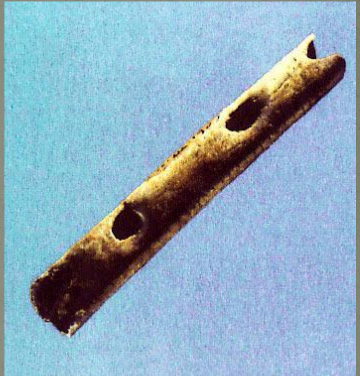
Флейта из кости птицы. Эпоха позднего палеолита.