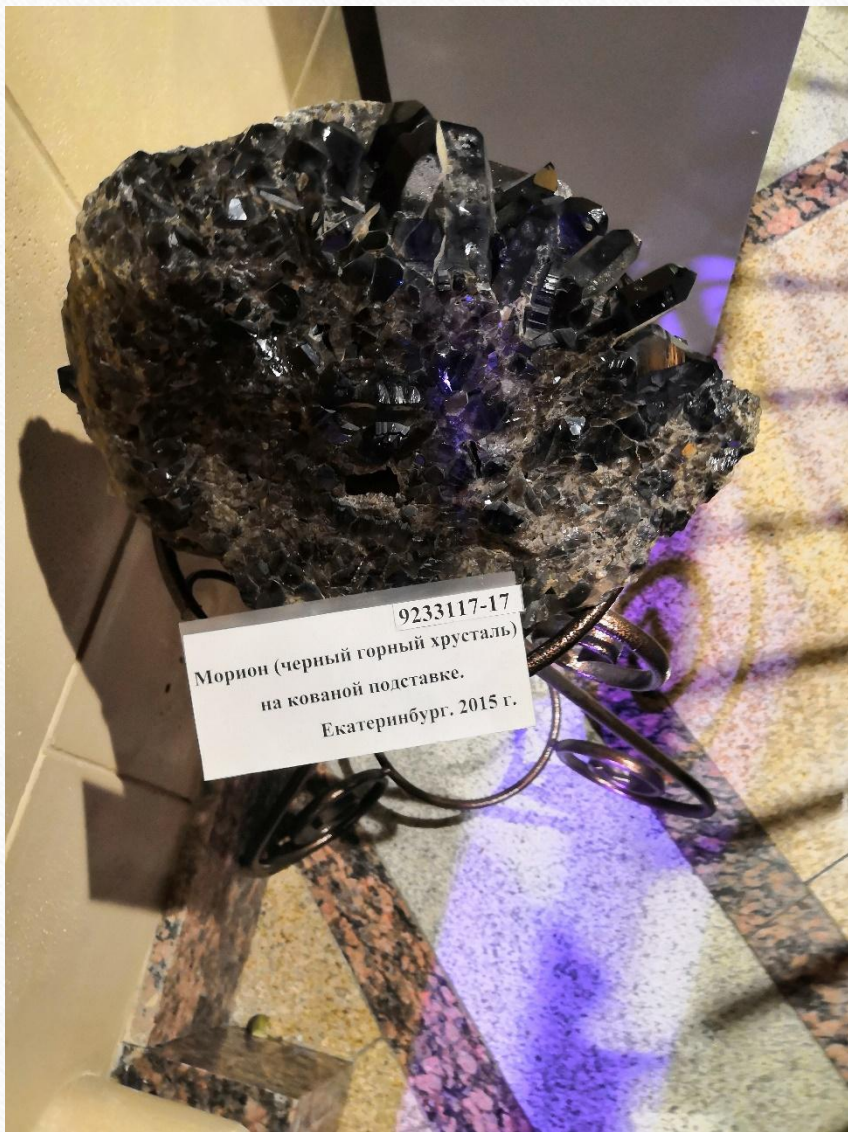
9233117-17 Морион (чёрный горный хрусталь) на кованой подставке. Екатеринбург. 2015 г.

Это чёрный горный хрусталь, использовавшийся в декоре станций метро.