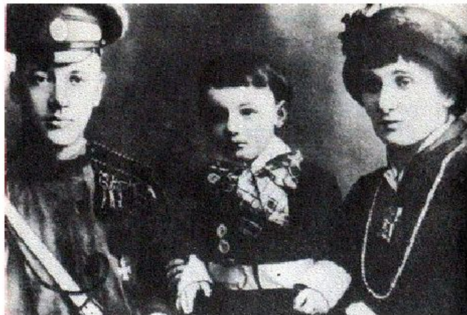
Николай Гумилев, Анна Ахматова и их сын, Лев 1914 год.