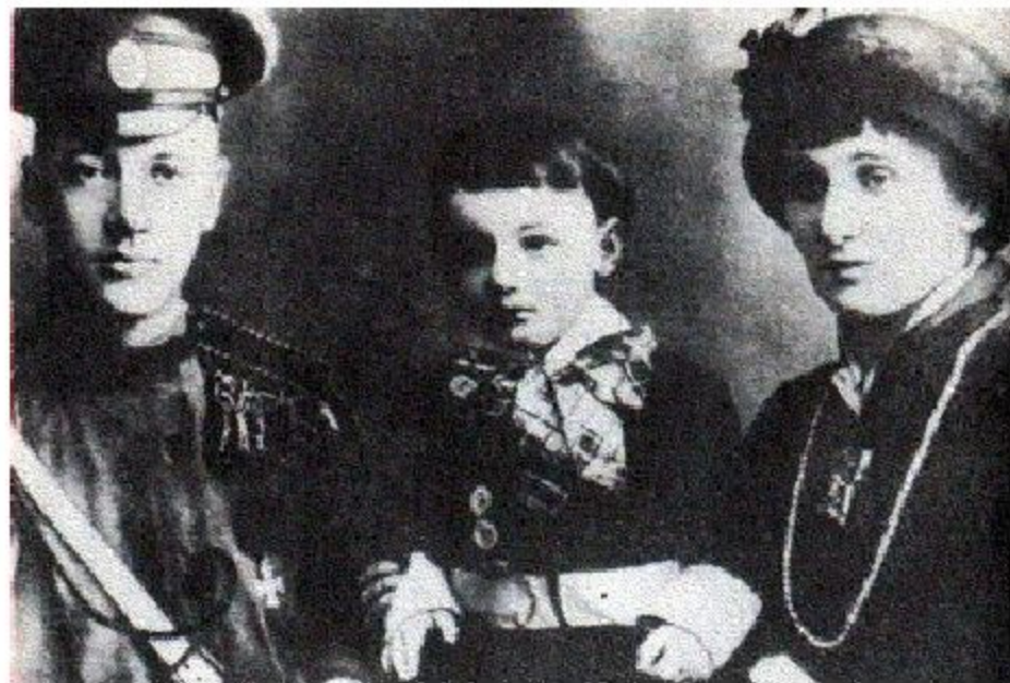
Николай Гумилев, Анна Ахматова и их сын, Лев 1914 год.