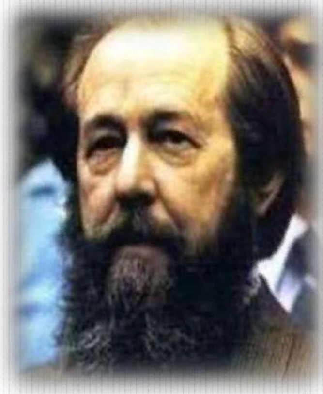
Александр Исаевич Солженицын (1918 – 2008 гг.)