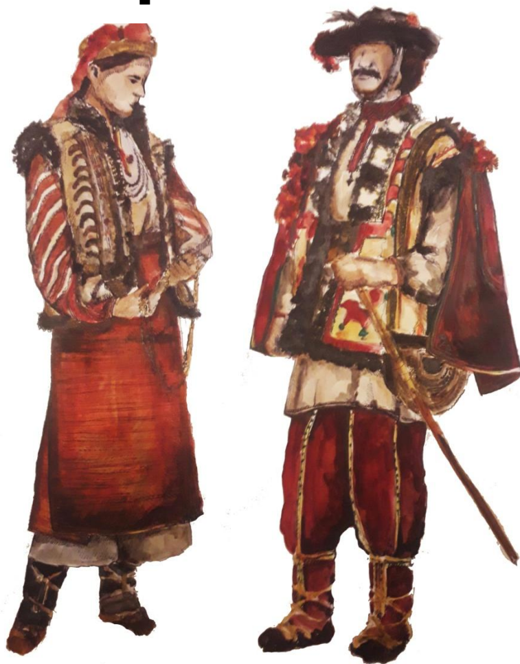
Гуцульский народный костюм