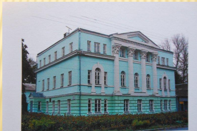
Дом-музей на родине Г.В. Свиридова в городе Фатеж

(ТРАНСПОРТНОЕ ОБСЛУЖИВАНИЕ, ЭКСКУРСИОННОЕ ОБЛУЖИВАНИЕ, ВХОДНЫЕ БИЛЕТЫ, ЧАЕПИТИЕ).