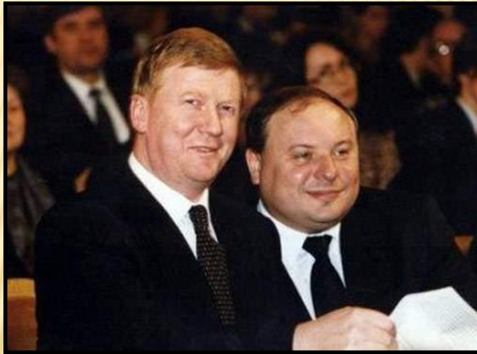
Инициаторы приватизации: Анатолий Чубайс и Егор Гайдар