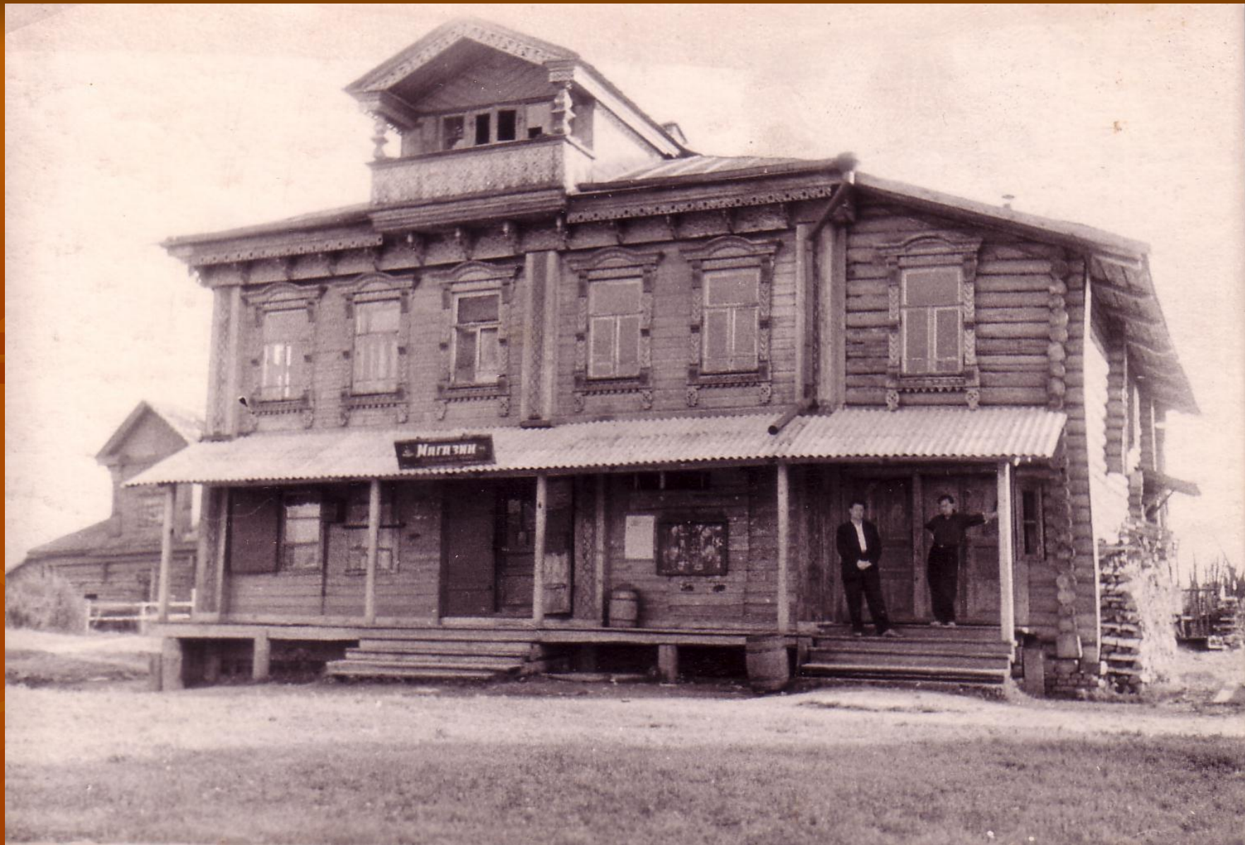
Дом Крундышевых в Елохово за 8-10 лет до сноса.