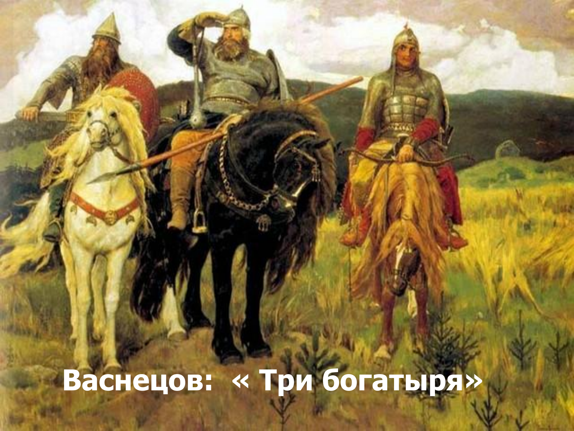
Васнецов: «Три богатыря»