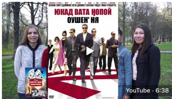
Ненецкие разговоры. Часть 04. Счет 64 просмотра