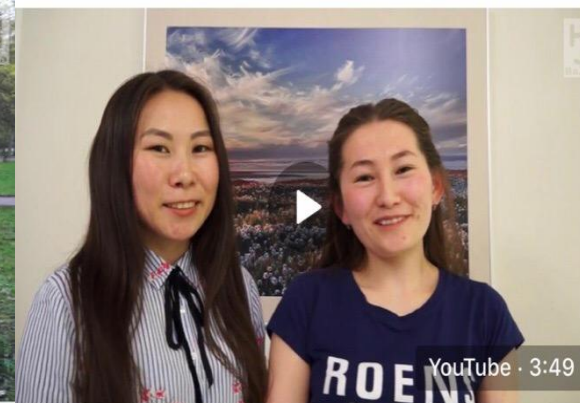
Ненецкие разговоры. Часть 03. Знакомство 94 просмотра