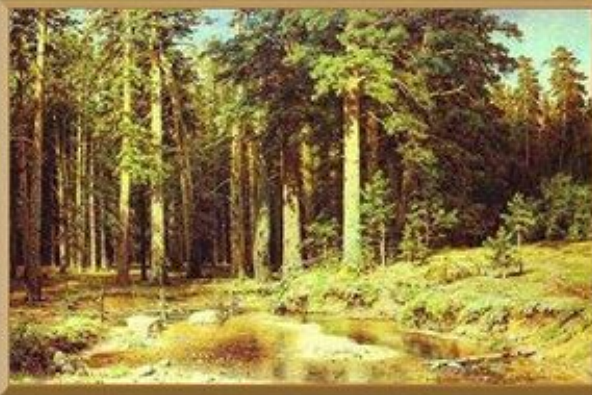
Корабельная роща. (1898 г.) Русский музей

Петр I организовал действенную охрану корабельных рощ, создав систему контроля (в составе Адмиралтейской коллегии была открыта вальдмейстерская канцелярия с вальдмейстерами и лесными надзирателями на местах) и установив строгие наказания за незаконные порубки.