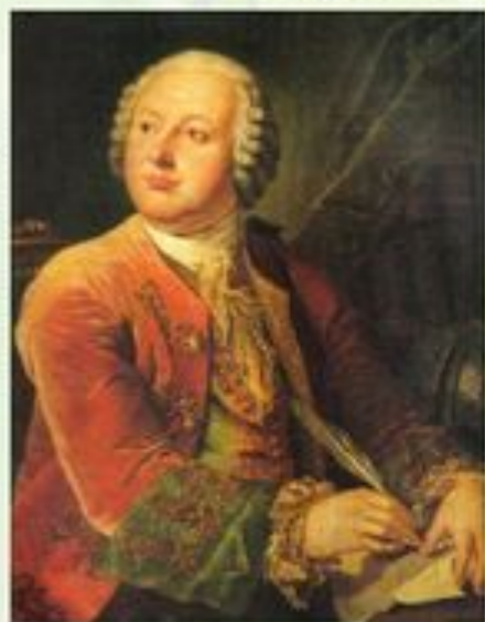
Михаил Васильевич ЛОМОНОСОВ (1711-1765)

К этому же времени относятся первые в России научные работы, содержащие мысли о необходимости бережного отношения к природным ресурсам (труды С. П. Крашенинникова, М. В. Ломоносова).