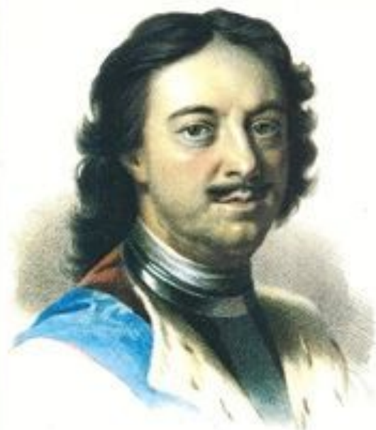
Peter the Great 1682-1725

Большой вклад в дело охраны природы в России внес Петр I. Он принимал меры для рационального использования и воспроизводства природных ресурсов, т.е. подходил к природоохранной деятельности значительно шире, чем это было принято в тот период.