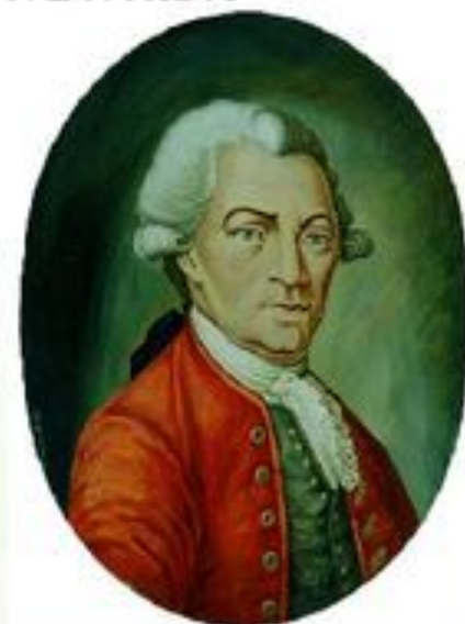
Степан Петрович КРАШЕННИКОВ (1711-1755)