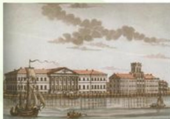
Здание академии наук (XVIII в.)