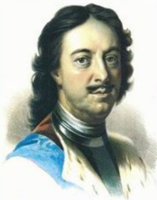
Peter the Great 1672 - 1725

В 1888 г. в России было принято Положение о сбережении лесов, запрещавшее сплошные рубки и установившее категории защитных лесов.