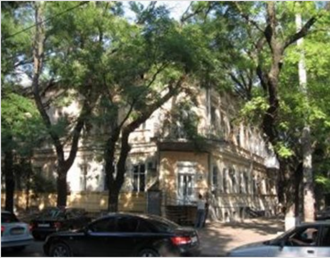
Дом в Одессе, где родился Багрицкий