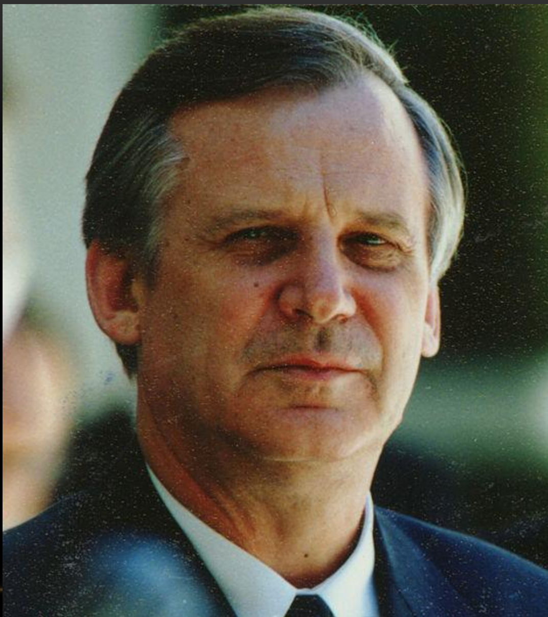
Председатель Совмина Н.И. Рыжков